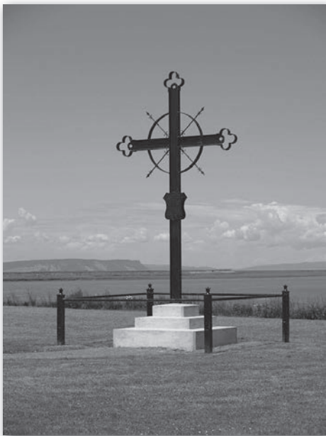
Croix de la Déportation, situé à Horton Landing.

Grand-Pré, un nom qui incarne une période bouleversante de l'histoire de l'Acadie. Pour beaucoup, il évoque la Déportation ou le Grand Dérangement. Pour moi, et ceux et celles qui au cours des ans ont été fascinés par ce lieu de mémoire, Grand-Pré est avant tout un symbole d'espoir et de résilience. Depuis 2012, le Paysage de Grand-Pré, qui comprend le lieu historique national du même nom, est inscrit sur la Liste des sites du patrimoine mondial de l'UNESCO .