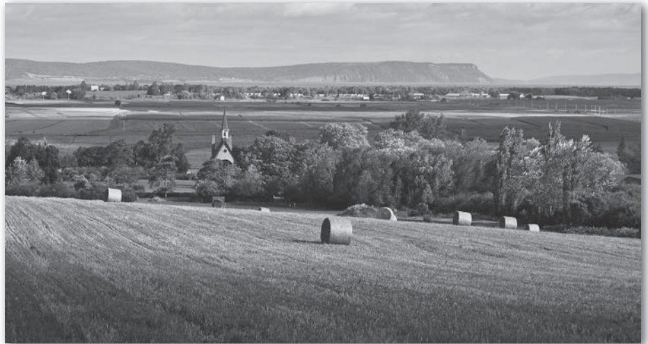
Vue du paysage de Grand-Pré, site du patrimoine mondial de l'UNESCO.

Le paysage de Grand-Pré témoigne de manière exceptionnelle d'un établissement agricole traditionnel créé au xvii e siècle par les Acadiens, qui l'ont reconquis de la mer et qui est encore en usage grâce à l'utilisation des mêmes