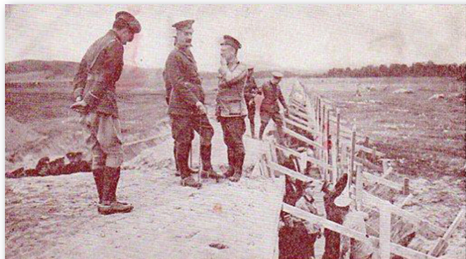
INSPECTION DE LA RANGEE DE 1500 CIRLES AU CAMP DE VALGARTIER, QUEBEC. Un des tributs du Canada à l'Angleterre et à la France. M. N. C. 4.

À leur arrivée au Port de Québec, les militaires marcheurs ont été chaleureusement applaudis par la foule présente avant de monter à bord du destroyer NCSM ATHABASKAN et du navire américain USS OAK HILL, tous deux à Québec dans le cadre du Rendez-vous naval pour une brève cérémonie lors de laquelle tous les marcheurs se sont vu remettre le jeton (un coin) du marcheur en guise de félicitations pour leur participation à cette marche. Pour cette occasion rare et unique, les trois composantes des Forces Armées canadiennes ont été réunies un bref instant lorsque deux avions CF-18 de la Base de Bagotville ont effectué un passage remarqué au-dessus des deux navires amarrés au pied du majestueux Château Frontenac.