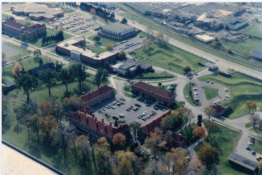
Vue aérienne du Collège militaire royal de Saint-Jean, 1994.

Malgré ces constatations, la Défense nationale développe des outils de perfectionnement et graduellement, se réinstalle à Saint-Jean, louant les installations de l'ancien Collège militaire à la Corporation du campus du Fort Saint-Jean 23 . Finalement, le 19 juillet 2007, la population apprend avec soulagement que le Collège militaire royal de Saint-Jean rouvrira ses portes, avec un nouveau mandat : offrir une formation collégiale reconnue par le ministère de l'Éducation du Québec, en sciences humaines ou sciences de la nature, d'une durée de deux ans (quatre sessions). De