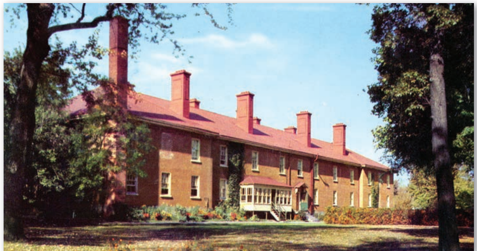
Mess des officiers du Collège militaire royal de Saint-Jean vers 1955. Construit en 1839, l'édifice est toujours présent de nos jours.

plus, les élèves ayant déjà obtenu une formation collégiale, ou ceux qui viennent de l'extérieur du Québec, peuvent suivre un programme universitaire d'une année (sciences humaines ou sciences de la nature), équivalente à la première année universitaire du Collège militaire royal de Kingston 24 . Désormais en phase de consolidation, le programme actuel a jeté les bases nécessaires pour envisager l'avenir du Collège avec optimisme. Puisse son demi-siècle d'histoire inspirer aux leaders d'aujourd'hui les leçons nécessaires pour permettre au phénix de renaître de ses cendres.