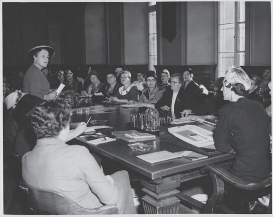
Année 1950, discussion au niveau provincial.

Les Cercles de Fermières seront le roc sur lequel pourra s'édifier la restructuration économique. Voici quelques initiatives intéressantes : l'achat des produits de chez nous, une campagne pour une meilleure nutrition, la mise sur pied de bibliothèques dans les