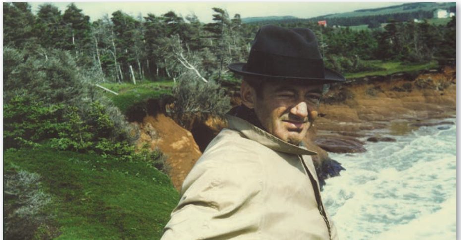
Félix Leclerc en tournée en Gaspésie au début des années 1960.

Par la transmission orale, la chanson folklorique a la particularité de permettre des interprétations multiples, contrairement à la chanson littéraire ou celle transmise par le disque qui offre une version unique. Si la voix demeure l'unique instrument du chanteur traditionnel, la chanson littéraire ou écrite qui se propage dans les années 1930, entre autres par La Bolduc et le mouvement de La Bonne Chanson , se fait maintenant accompagner d'un piano ou d'une guitare.