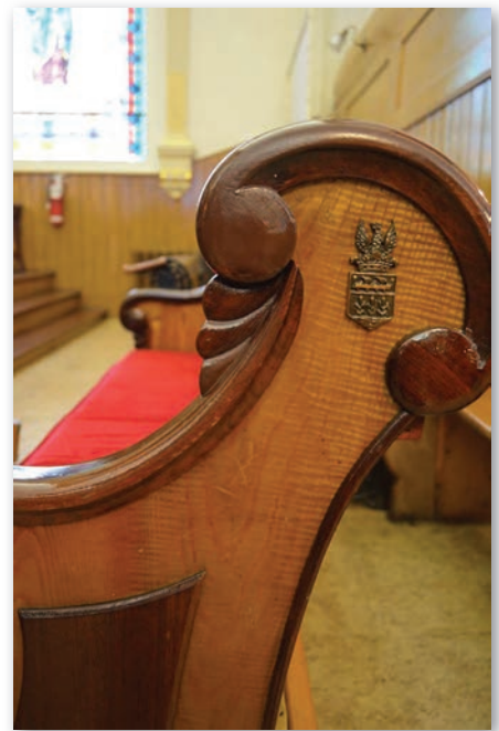
Le banc seigneurial des Joly de Lotbinière à Lotbinière.

Un second pan de l'analyse de la mémoire seigneuriale porte sur les lieux de mémoire seigneuriaux et agit en complémentarité avec les enquêtes orales. Existe-t-il une mémoire seigneuriale dans certaines localités? Dans l'affirmative, quelle mémoire est mise en valeur? « Réfléchir sur un objet patrimonial, c'est offrir une perspective sur la mémoire d'une communauté 4 . » Or, quels sont les lieux de mémoire seigneuriaux (moulin, manoir, plaques commémoratives, fêtes et traditions...)? Comment ceux-ci s'inscrivent-ils dans le récit historique local? Quelle fonction tiennent ces lieux seigneuriaux (lieux touristiques, centres d'interprétation, jardins, résidences privées...)? Sur quels acteurs et sur quelles périodes historiques met-on l'accent? L'analyse confrontera la mémoire et l'histoire de ces lieux.