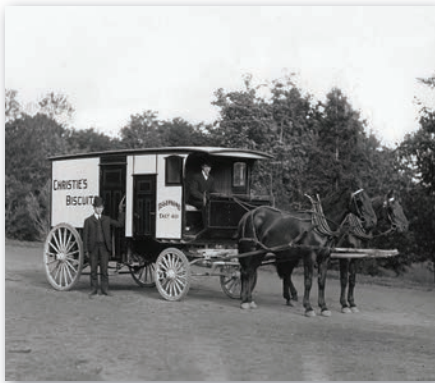
Christie's biscuit wagon, Montreal, QC, 1904, Wm Notman Sons. (Source : Wikimedia Commons, original.335)

Un consortium crée la Compagnie d'assurance mutuelle sur la vie, de Montréal, dite du Soleil (plus tard, la Sun Life). En 1881, la compagnie de William Cassils est liée à la Compagnie du télégraphe de Montréal. Fondée en 1888, la Federal Telephone Company exploite le service téléphonique à Montréal jusqu'à sa vente en 1891 à la Compagnie canadienne de téléphone Bell.