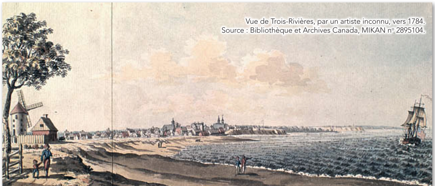
Vue de Trois-Rivières, par un artiste inconnu, vers 1784.

C'est sous l'ordre du gouverneur Vaudreuil que des Acadiens, réfugiés dans la région de Québec, se sont déplacés dans la région de Trois-Rivières et ensuite, dans la région de Montréal.