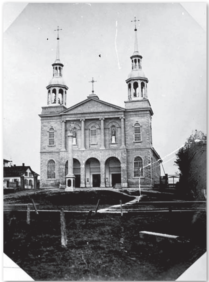
Église de St. Grégoire [P.Q.].