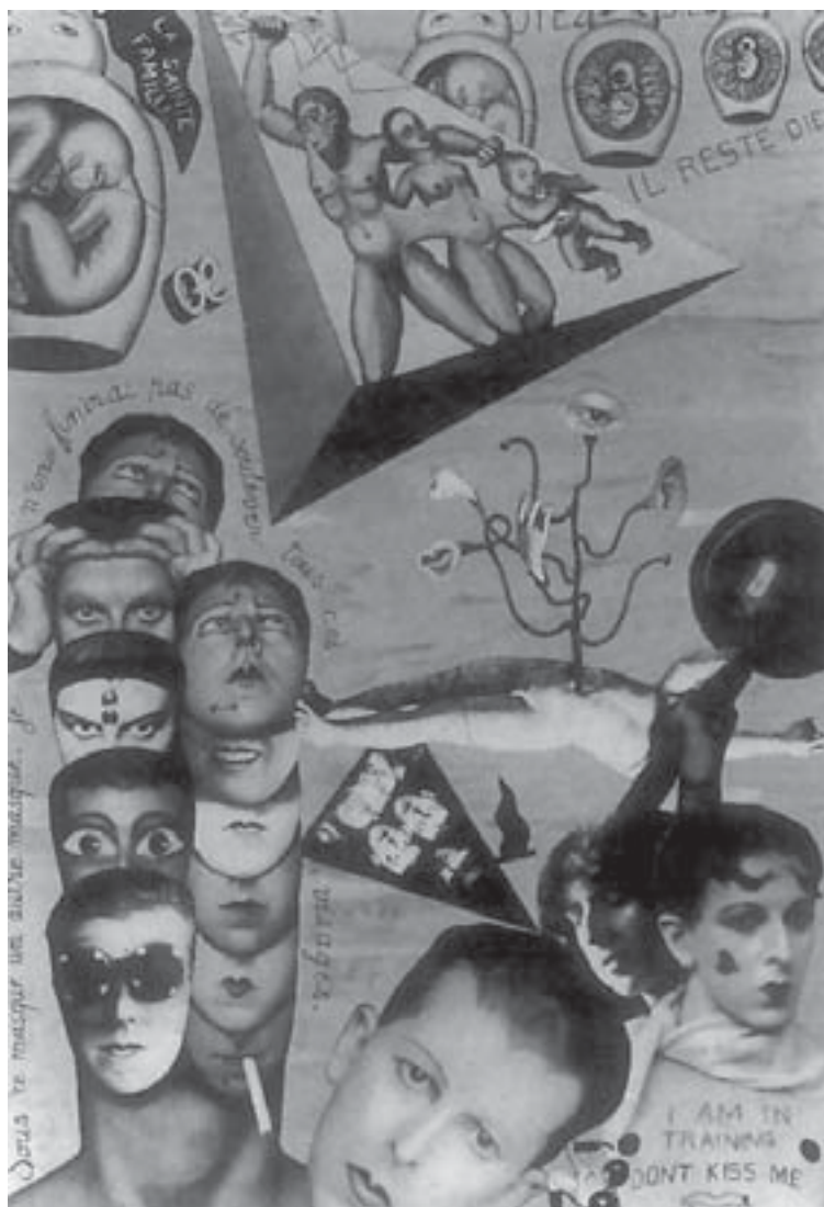
Fig. 5. Claude Cahun, Marcel Moore, Aveux non avenus, Tableau X , Photomontage, 1929-1930, coll. privée (avec l'aimable autorisation de la Galerie Zabriskie, New York).