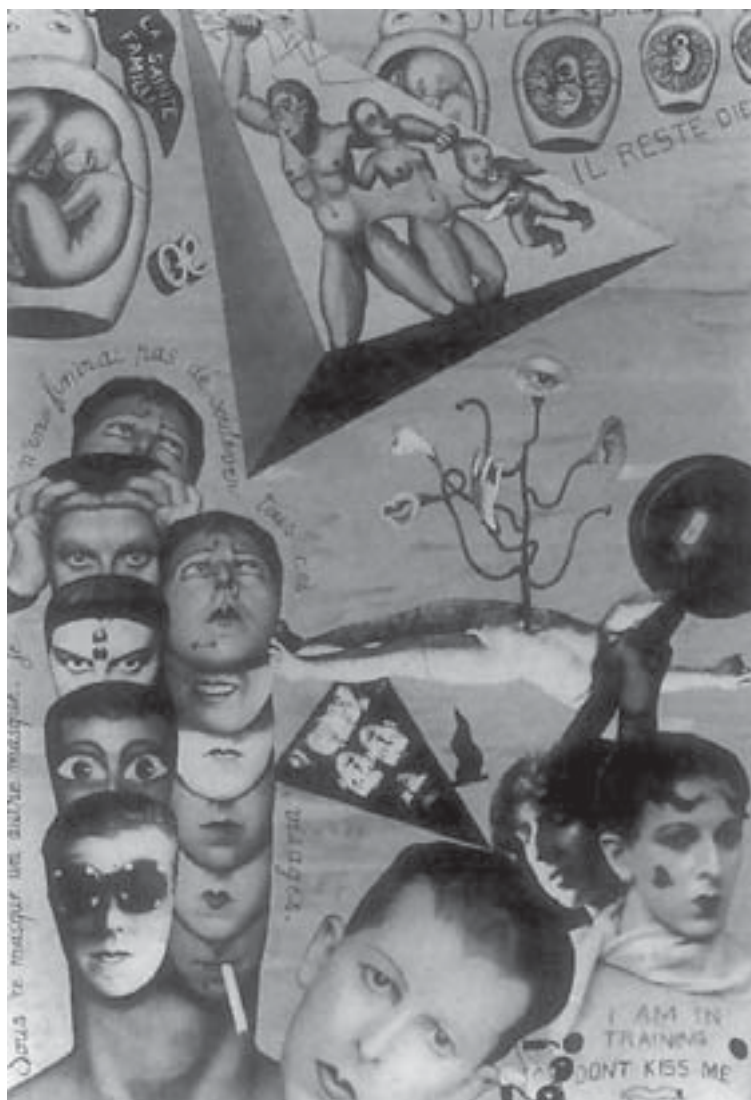
Fig. 5. Claude Cahun, Marcel Moore, Aveux non avenues, Tableau X , Photomontage, 1929-1930, coll. privée (avec l'aimable autorisation de la Galerie Zabriskie, New York).