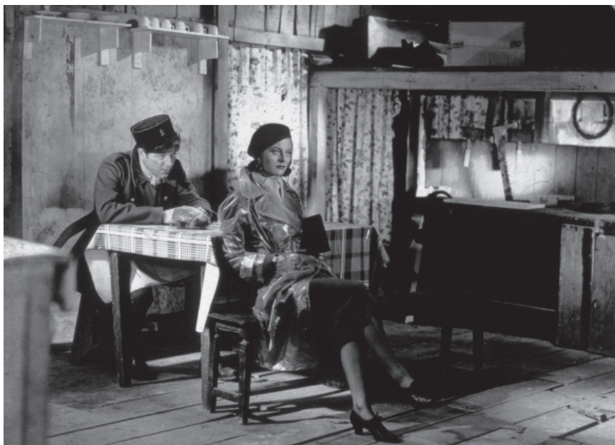
Fig. 2. Jean Gabin et Michèle Morgan dans Le quai des brumes . Source : Henri Alekan, Des lumières et des ombres , Paris, Librairie du Collectionneur, 1991 [1984].

les localiser. Elles font de l'espace un labyrinthe où il est difficile de distinguer le centre de la périphérie, l'essentiel du secondaire. Tout l'espace de l'image devient un plan expressif et le spectateur se transforme en constructeur dans un horizon de significations ouvert et fluide. La lumière qui échappe à tout code clair, et les ombres, totalement inextricables, créent un mouvement qui correspond exactement au discours des sexes (fig. 2). « Hommes et femmes ne se comprendront jamais », s'exclame Jean Gabin, « parce qu'ils vivent dans des mondes différents. » Mais ses paroles agressives naissent d'un mouvement intérieur qu'il ne s'avoue pas encore : la convoitise.