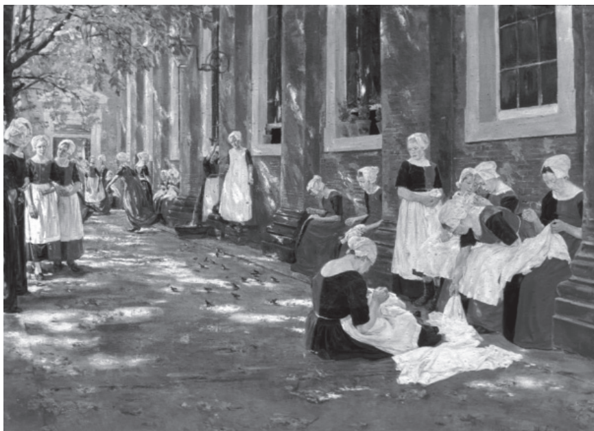
Fig. 3. Max Liebermann, Freistunde im Amsterdamer Waisenhaus (1882), Städelsches Kunstinstitut Frankfurt am Main.

Il faut aussi noter qu'il a de toute évidence actualisé les grands tableaux de la peinture. Cette lumière latérale arbitraire qui se glisse si durement avait déjà été la marque de Caravaggio. Il l'avait maîtrisée à un tel degré de perfection qu'on pourrait presque parler de spotlight . Schüfftan, le peintre, connaissait sans aucun doute ces mises en scène de la lumière.