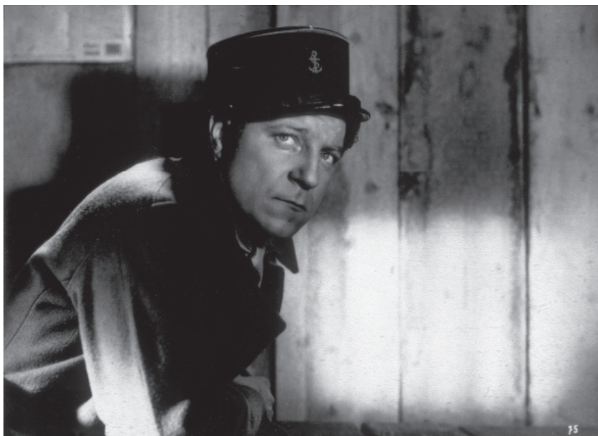
Fig. 1. Jean Gabin dans Le quai des brumes (Marcel Carné, 1938).

Dans ces « images-pensées », la distinction entre intérieur et extérieur est abolie. Les deux sphères sont représentées par la lumière artificielle. Dans Le quai des brumes (Marcel Carné, 1938) par exemple, l'extérieur n'est pas un paysage avec dégradés et gradations, mais une confrontation de clairs et d'obscurs, un chiaroscuro radical.