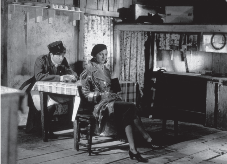
Fig. 2. Jean Gabin et Michèle Morgan dans Le quai des brumes . Source : Henri Alekan, Des lumières et des ombres , Paris, Librairie du Collectionneur, 1991 [1984].

les localiser. Elles font de l'espace un labyrinthe où il est difficile de distinguer le centre de la périphérie, l'essentiel du secondaire. Tout l'espace de l'image devient un plan expressif et le spectateur se transforme en constructeur dans un horizon de significations ouvert et fluide. La lumière qui échappe à tout code clair, et les ombres, totalement inextricables, créent un mouvement qui correspond exactement au discours des sexes (fig. 2). « Hommes et femmes ne se comprendront jamais », s'exclame Jean Gabin, « parce qu'ils vivent dans des mondes différents. » Mais ses paroles agressives naissent d'un mouvement intérieur qu'il ne s'avoue pas encore : la convoitise.