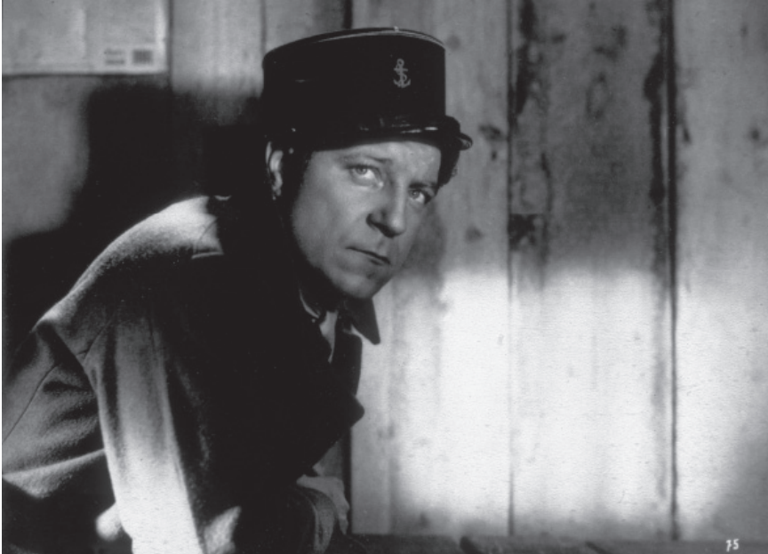
Fig. 1. Jean Gabin dans Le quai des brumes (Marcel Carné, 1938).

Dans ces « images-pensées », la distinction entre intérieur et extérieur est abolie. Les deux sphères sont représentées par la lumière artificielle. Dans Le quai des brumes (Marcel Carné, 1938) par exemple, l'extérieur n'est pas un paysage avec dégradés et gradations, mais une confrontation de clairs et d'obscurs, un chiaroscuro radical.