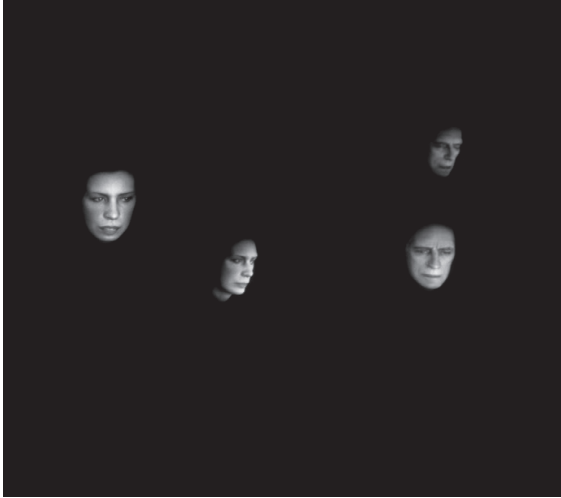
Fig. 2. Les aveugles. Fantasmagorie technologique I , 2002, © photo Richard-Max Tremblay (avec l'aimable autorisation d'UBU, compagnie de création).

utilise très peu les effets de superposition des voix et des sons, du moins jamais jusqu'à créer un effet de brouillage ou de discontinuité.