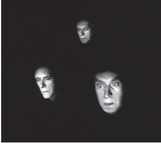
Fig. 1. Les aveugles. Fantasmagorie technologique I , 2002.