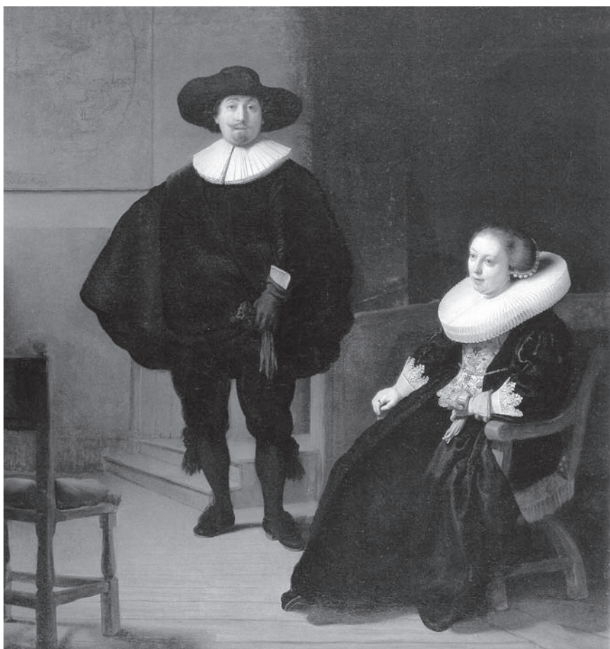
Fig. 2. Rembrandt, Portrait d'un couple élégant , 1633, huile sur toile, 131,6 cm x 109 cm. Isabella Stewart Gardner Museum, Boston.