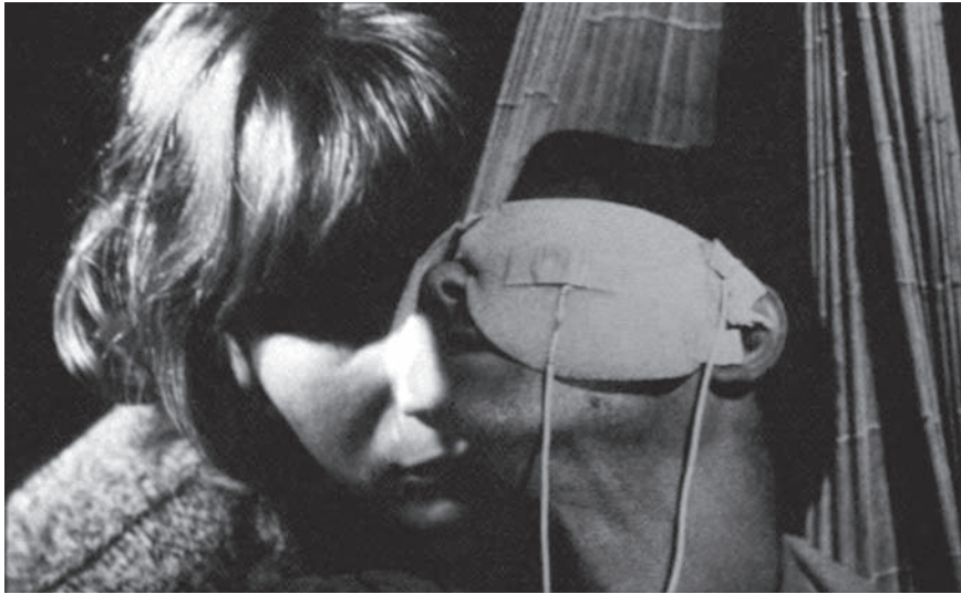
Fig. 3. Chris Marker, La jetée , 1963

temps. Le visage de la femme entaille et reprise le temps, y imprimant un nouvel instant de bonheur.