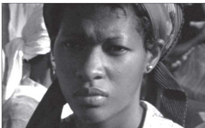
Figs. 5-7. Chris Marker, Sans soleil , 1983 © Argos Films. Avec l'aimable autorisation de Argos Films.