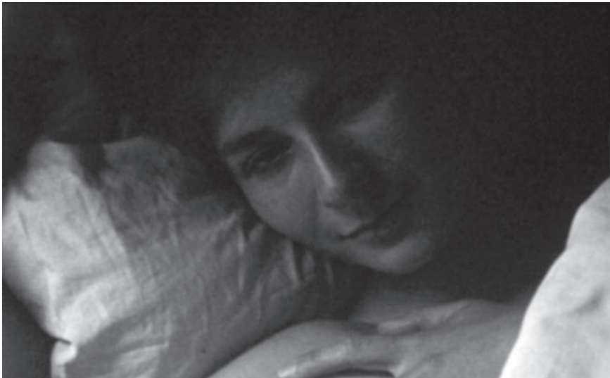
Figs. 1-2. Chris Marker, La jetée , 1963