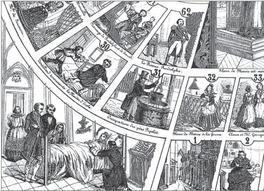
Fig. 1. Jeu de l'oie narratif: Le jeu des mystères de Paris (xix e siècle)

Réduit à cette structure abstraite, le jeu de l'oie a tout l'agrément d'une leçon de calcul. Sa popularité durable ne tient pas dans l'ingénuité des règles, qui ne laissent aucun choix aux joueurs, mais dans les diverses manières de l'habiller de thèmes et d'illustrations qui doublent l'agrément social de la compétition entre amis d'une satisfaction artistique autant qu'imaginative (voir figures 1, 2 et 3).