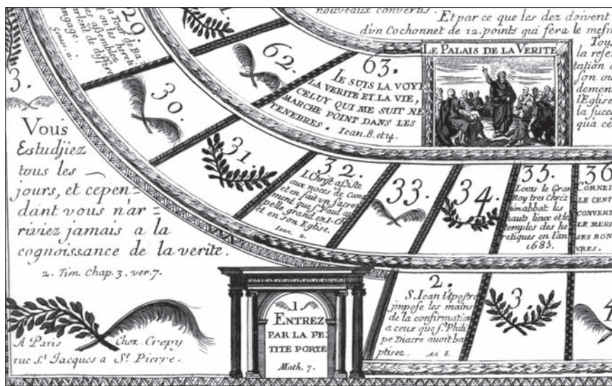
Fig. 3. L'École de la Vérité pour les Nouveaux convertis (XVII e siècle)

sur lesquels on ne jouait plus 18 ». C'est également le cas des nombreux jeux dédiés à la publicité (« vins de France », « jeu du livret » distribué par une banque). Dans ces exemples, la narrativité se développe au détriment du jeu.