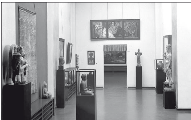
Fig. 5: Albert Renger-Patzsch, Vue intérieure d'une salle du Museum Folkwang à Essen , ca. 1930, accrochage d'Erich Gosebruch. Épreuve au gélatino-bromure d'argent, 16,8 x 22,7 cm.

ou quotidiens issus de cultures non européennes. À la mort d'Osthaus en 1921, la ville de Hagen, hostile à son initiative, refuse de prendre le musée en charge. La collection Osthaus trouve alors preneur dans la ville d'Essen qui fonde le musée Folkwang en 1922, en fusionnant sa nouvelle acquisition avec le musée municipal existant. La collection Osthaus y sera exposée à partir de 1929 dans un bâtiment construit à cette occasion par l'architecte Eduard Körner. Célébré par de nombreuses personnalités de la scène artistique internationale, le Museum Folkwang avait notamment impressionné le futur directeur du Museum of Modern Art, Alfred H. Barr, et son architecte, Philip Johnson 25 . Pendant la Seconde Guerre mondiale, tous les bâtiments du musée ont été démolis par des bombardements. Quant aux œuvres de la collection, environ 1400 furent classées « dégénérées » et confisquées par le pouvoir national-socialiste. Plusieurs furent exposées à l'Exposition d'art dégénéré à Munich de 1937. À partir des années 1950, certaines ont pu être rachetées ou récupérées, d'autres ont disparu ou se trouvent dispersées dans d'autres collections 26 .