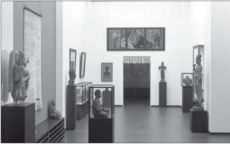
Fig. 6: Simon Starling, Nachbau ( Reconstruction ), une épreuve au gélatino-bromure d'argent, 17,3 × 23 cm. © Simon Starling.

Le projet Nachbau est inspiré d'une série de photographies réalisées dans les années 1930 par le photographe allemand Albert Renger-Patzsch, principalement connu comme l'auteur du livre de photographies Die Welt ist schön ( Le monde est beau , 1928). Entre 1929 et 1944, en échange d'un espace d'atelier au sein du Museum Folkwang d'Essen, Renger-Patzsch a agi à titre de photographe non officiel de ses collections, documentant aussi bien des œuvres et objets individuels que des vitrines ou des vues de salles entières. Dans sa description du projet, Simon Starling précise que cette entente n'était pas formellement reconnue par l'institution muséale, contribuant à ce que les archives photographiques demeurent longtemps inconnues au sein de la succession de Renger-Patzsch 27 . Pour Nachbau , Starling choisit quatre des vues