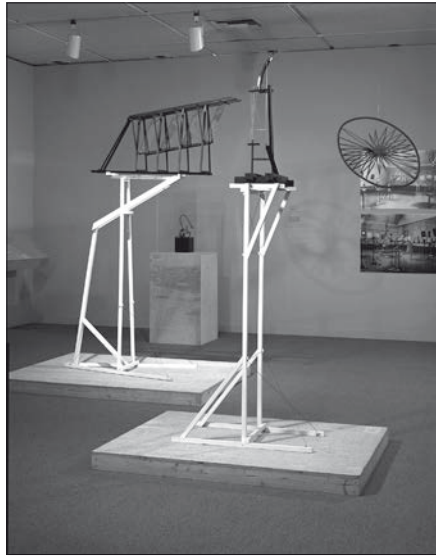
Fig. 4: Vue partielle de l'accrochage de l'exposition The Avant-Garde in Russia: New Perspectives 1910-1930, Los Angeles County Museum of Art, 8 juillet-28 septembre 1980. Reconstructions de pièces de G. Stenberg, A. Rodtchenko, K. Medounetski provenant de la 2 e exposition d'Obmokhou. Au mur: photographies de la 2 e exposition d'Obmokhou.

Au lieu de reconstituer systématiquement toutes les constructions exposées en 1921 et de reproduire l'agencement spatial visible sur les photographies d'époque, le LACMA n'avait inclu qu'un nombre limité de reconstructions et les avait présentées sur des socles proéminents ou sous vitrine, indiquant ainsi sans ambages leur encadrement par l'institution muséale. Tout comme pour la réplique de l'exposition 0,10 , deux vues photographiques de l'exposition de 1921 joutaient les reconstructions, amenant le visiteur à faire, littéralement, le va-et-vient entre la représentation d'un événement passé dans la photographie, et l'évocation contemporaine de cet événement par la reconstruction spatiale de quelques objets disparates. C'est par l'introduction du référent photographique, par son usage au sein de l'exposition et par les liens qu'il établissait avec les œuvres et reconstructions exposées, que le LACMA s'écartait de la voie de la reconstruction fidèle au profit d'une lecture du passé actualisée par le moment présent.