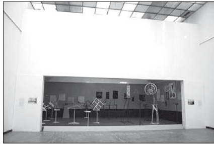
Fig. 2: Reconstruction de l'exposition de l'Obmokhou de 1921 dans les salles de la collection permanente de la Galerie nationale Tretiakov, Moscou. Auteur: Viatcheslav Koléitchouk, 2006. Exécution SARL «Vkhoutemas XXI e siècle».

exposition avait permis aux constructivistes dits « de laboratoire » de présenter publiquement les résultats des débats menés pendant les quatre mois précédents entre artistes, architectes et historiens de l'art au sein de l'Institut de culture artistique de Moscou ( Inkhokh ) sur la définition du concept de « construction » comme futur fondement de l'art 9 (fig. 3).