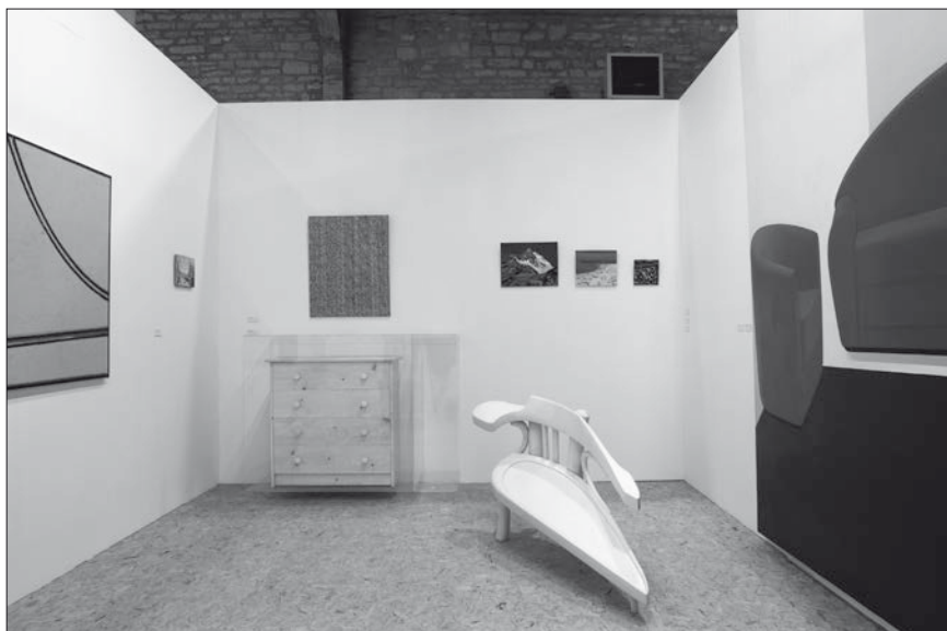
Fig. 6 : Period Room .

nos sociétés de consommation. Cela va du plateau télévisuel ou de cinéma en passant par les showrooms , les resorts tels Celebration en Floride ou La vallée des marques à Marne-la-Vallée jusqu'au Mont-Saint-Michel 9 . Il y a peu de différences, je pense, entre la visite des plateaux de tournage et le fait de se rendre chez Ikea : on y va pour voir des reconstitutions et les « consommer ». C'est une situation fascinante. Elle révèle des enjeux esthétiques concernant le rapport entre l'image, le lieu et la fiction auxquels il faut réfléchir.