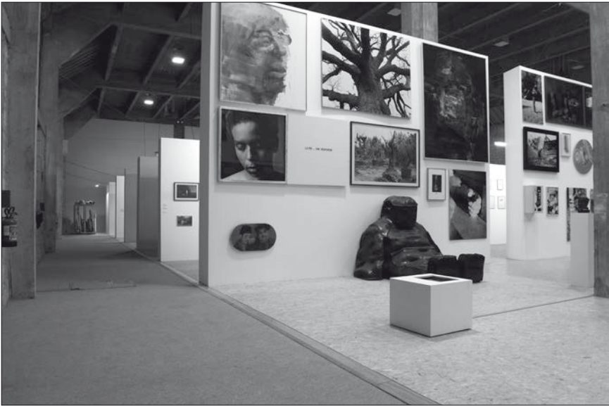
Fig. 4: 90', vue du côté nord et détail de La Grande Galerie .

plaçait le visiteur au centre même du projet architectural à travers trois types de cheminement différents : le premier destiné aux touristes, le deuxième aux esthètes et le troisième aux spécialistes. D'une certaine manière, le projet 90' est assez proche de ces « balades architecturales » individualisées que prônait Le Corbusier. Quant à la déambulation du visiteur, il n'y avait pas à proprement parler de signalétique directionnelle au sein de 90', car le dispositif était directif en soi. Mise à part une flèche indiquant à l'entrée le sens de la visite et les numéros affichés au départ de chaque galerie, les visiteurs, une fois embarqués dans le dispositif, suivaient spontanément la diagonale qui les menait d'une galerie à l'autre. Rarement, ils revenaient en arrière, bien qu'ils fussent parfaitement libres de le faire.