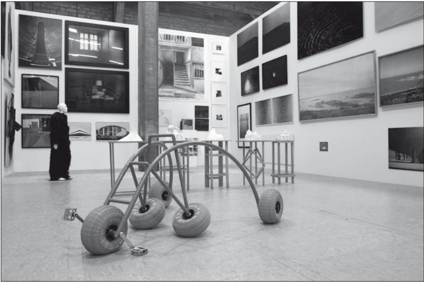
Fig. 5: La Grande Galerie .

... en référence à la Grande Galerie du Louvre ?