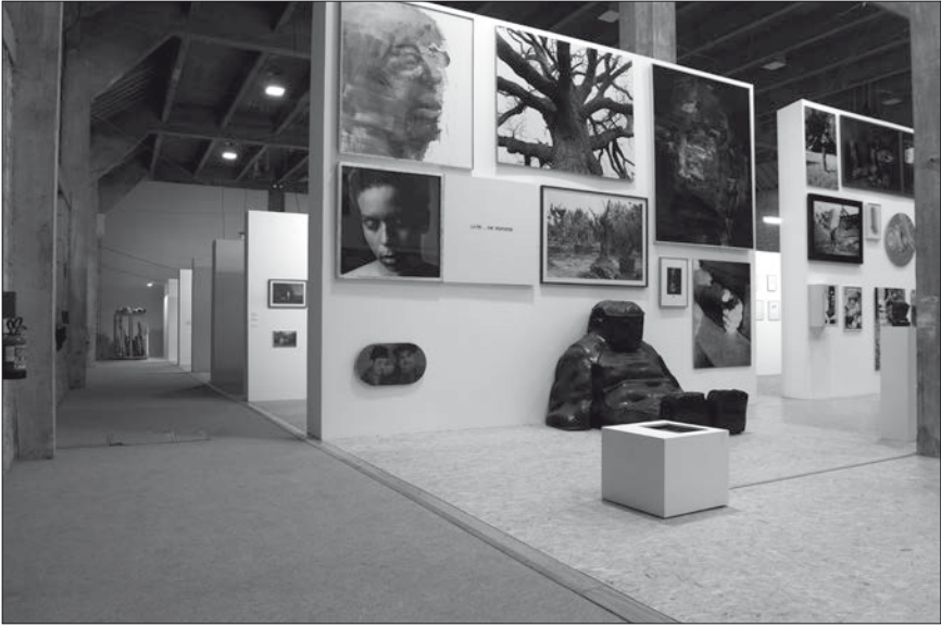
Fig. 4: 90', vue du côté nord et détail de La Grande Galerie .

plaçait le visiteur au centre même du projet architectural à travers trois types de cheminement différents : le premier destiné aux touristes, le deuxième aux esthètes et le troisième aux spécialistes. D'une certaine manière, le projet 90' est assez proche de ces « balades architecturales » individualisées que prônait Le Corbusier. Quant à la déambulation du visiteur, il n'y avait pas à proprement parler de signalétique directionnelle au sein de 90', car le dispositif était directif en soi. Mise à part une flèche indiquant à l'entrée le sens de la visite et les numéros affichés au départ de chaque galerie, les visiteurs, une fois embarqués dans le dispositif, suivaient spontanément la diagonale qui les menait d'une galerie à l'autre. Rarement, ils revenaient en arrière, bien qu'ils fussent parfaitement libres de le faire.