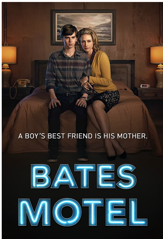
Fig. 1. Affiche de la saison 1 de Bates Motel , 2013.

¶ 12 Cependant, les vêtements de Norman et de Norma, leur voiture ainsi que leur goûts cinématographiques ( Double Indemnity , Wilder, 1944) et musicaux ( Mr. Sandman des Chordettes, 1958) renvoient à un temps suspendu. Conformément à la logique du reboot , la série est un pont entre le monde d'Hitchcock, ou de manière plus large l'époque classique du cinéma (qui est ainsi confirmée comme monde culte, que l'on peut citer), et le monde des nouvelles technologies.