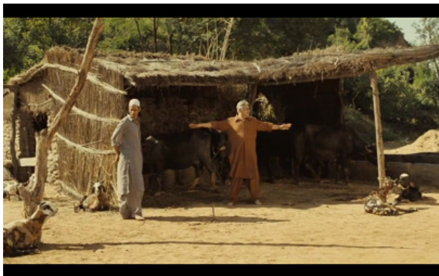
Figure 1. Photogramme du film West is West , Andy De Emmony, 2010. “We build here”.