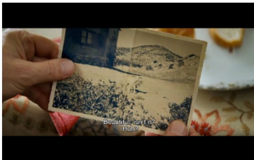
Figure 5. Photogramme du film Almanya: Willkommen in Deutschland , Yasemin Şamdereli, 2011. Heimat .

sa naturalisation récente, annonce avoir acheté une maison en Anatolie et impose un voyage à toute la famille pour aller la rénover, comme on irait renouveler allégeance à un pays. Il présente le pays, « heimat », à son petit-fils sur une photographie en noir et blanc où l'on voit une maison devant une montagne et, au centre, une chèvre. Ici déjà, maison et pays se télescopent (voir la figure 5).