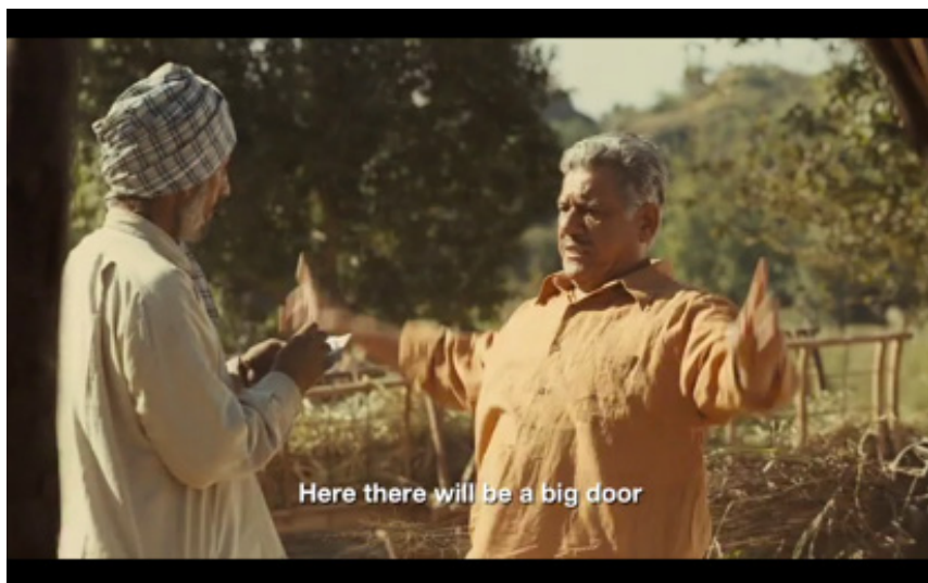
Figure 2. Photogramme du film West is West , Andy De Emmony, 2010. .