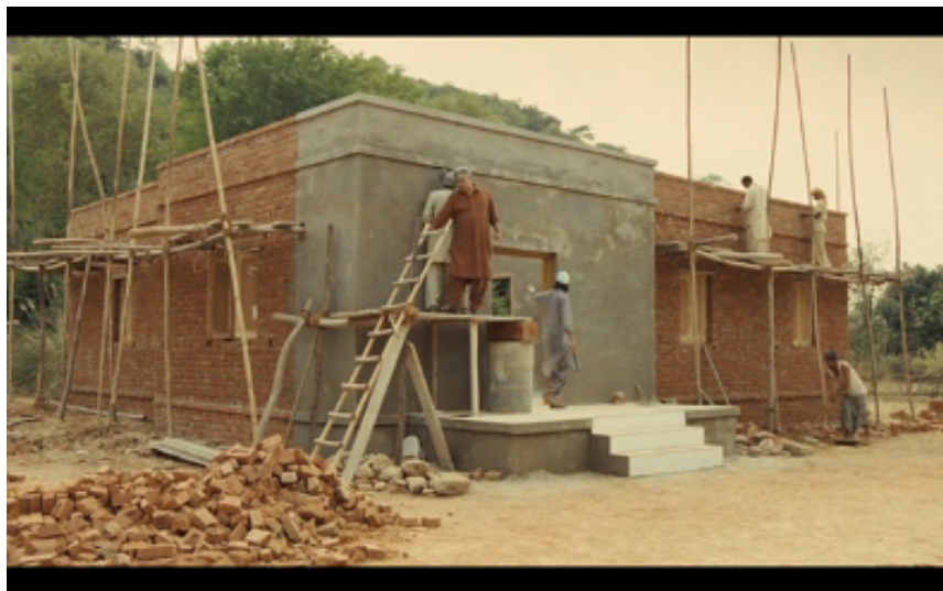
Figure 4. Photogramme du film West is West , Andy De Emmony, 2010. “We build here”.