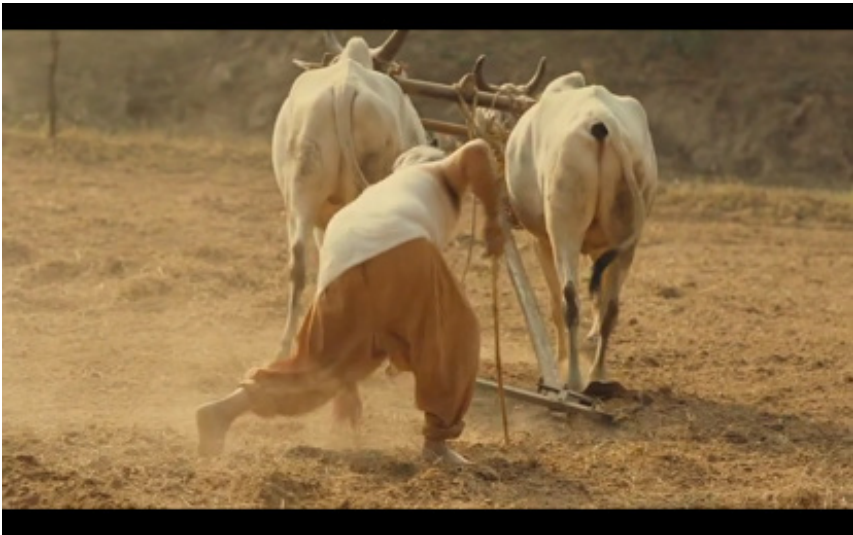
Figure 3. Photogramme du film West is West , Andy De Emmony, 2010.

Quelques secondes plus tard, la destruction de l'étable est achevée et la musique change de registre, se fait plus lente et triste : elle prépare le terrain à la nostalgie d'un homme dont la terre même lui échappe. Un Zahir déterminé à labourer sa terre lui-même à l'aide de deux buffles, entouré de ses deux fils, de son beau-fils, de Basheera et de ses filles, tente de manœuvrer son attelage, plein de maladresse (voir la figure 3). Comme dans la scène précédente, l'action est condensée et quelques secondes passent avant que, visiblement fatigué, l'homme s'avoue vaincu : « I go to the house », dit-il. Ici, ce n'est pas le choix de langue, mais le choix de mots qui est révélateur de la position de l'homme par rapport à « sa » maison : outre l'absence d'un pronom possessif, l'usage du terme house plutôt que home souligne la distance affective et le caractère purement architectural de la première demeure à ses yeux.