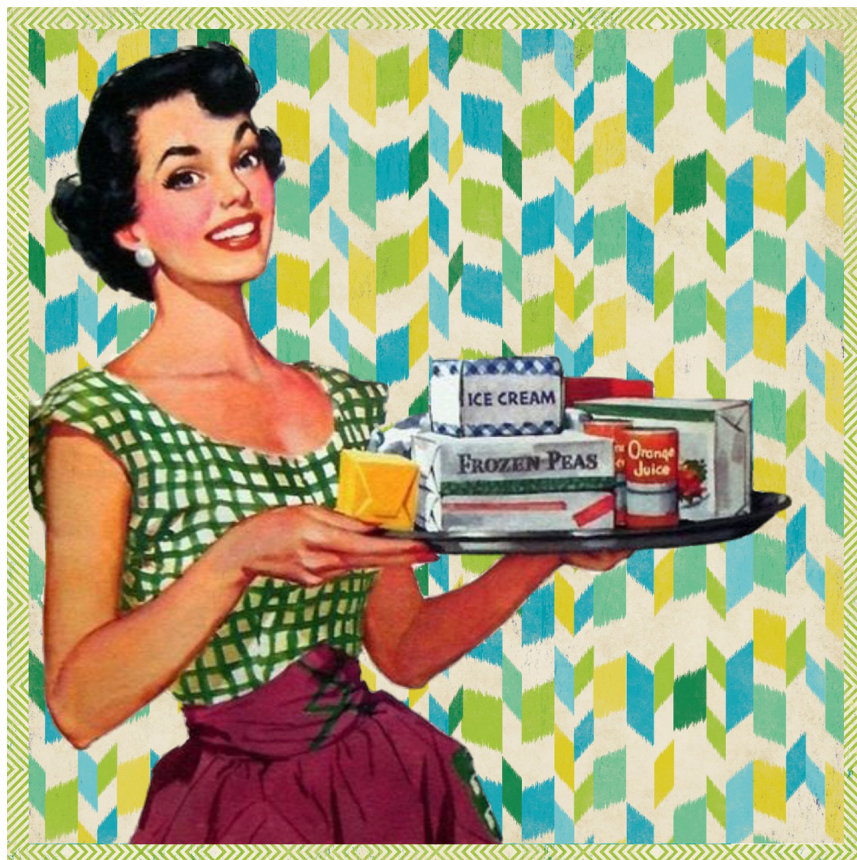
Figure 1. Exemple de publicité des années 1950

scènes où elle prépare le déjeuner dans la cuisine, renvoient à l'image idéalisée de la ménagère représentée dans les publicités des années 1950 et 1960 (voir la figure 1).