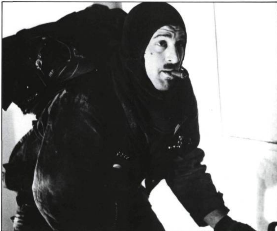
Robert De Niro, l'ingénieur rebelle de Brazil

Les personnages enfin, même si par instants ils semblent issus d'une B.D., sont tout à fait crédibles. Le principal, Sam Lowry, joué par un Jonathan Pryce au regard effaré, est un être à la fois intelligent, empêtré, persévérant et romantique-fou qui a pour supérieur le pleurnichard Monsieur Kurtzman (Ian Richardson), tyran bafoué. La mère de Sam, incarnée par l'excellente Katherine Helmond (connue surtout pour son rôle de Jessica dans la défunte émission de télé américaine Soap ), prise d'une peur effroyable de la vieillesse et de la mort, se plie aux extravagances les plus débridées de son dieu, le chirurgien esthétique. Michael Palin (membre lui aussi des Monty Python ) joue le rôle de l'ami de Sam qui, poussant la raison d'État jusqu'à la folie, devient son tortion-