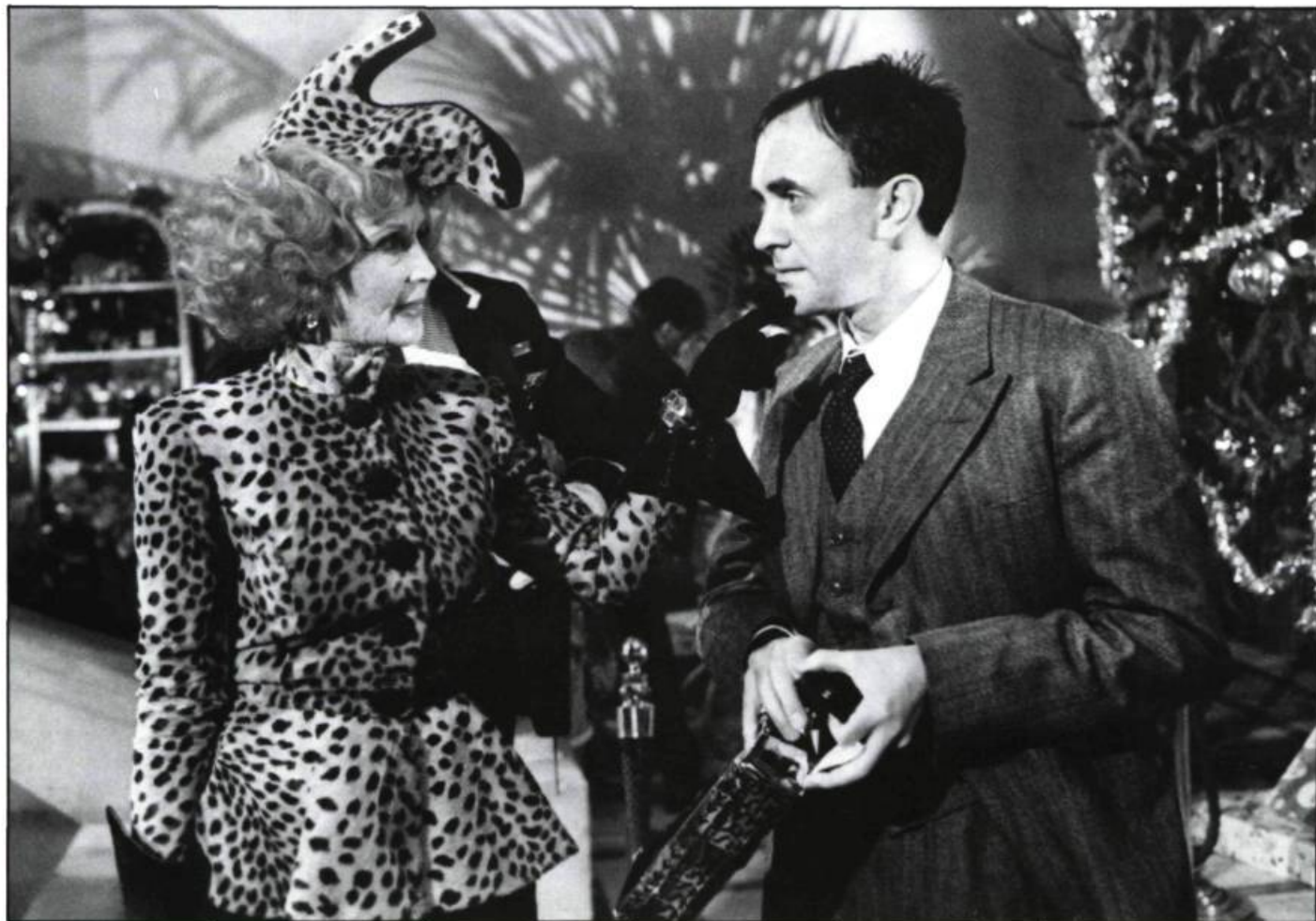
Katherine Helmond et Jonathan Pryce dans Brazil de Terry Gilliam

Brazil est donc l'histoire à la fois horrifiante et désopilante d'un homme évoluant dans la machine totalitaire qui peut-être sera la nôtre demain. Ce film étonnant est le produit de l'esprit de Terry Gilliam. Diplômé en sciences politiques aux États-Unis, illustrateur, puis signataire d'articles de magazines, Gilliam en 1969 fait partie de la première série télévisée du groupe Monty Python qui