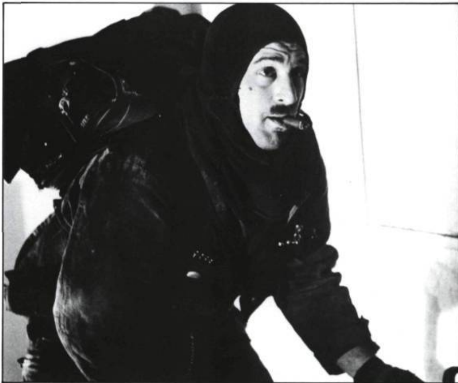
Robert De Niro, l'ingénieur rebelle de Brazil

Les personnages enfin, même si par instants ils semblent issus d'une B.D., sont tout à fait crédibles. Le principal, Sam Lowry, joué par un Jonathan Pryce au regard effaré, est un être à la fois intelligent, empêtré, persévérant et romantique-fou qui a pour supérieur le pleurnichard Monsieur Kurtzman (Ian Richardson), tyran bafoué. La mère de Sam, incarnée par l'excellente Katherine Helmond (connue surtout pour son rôle de Jessica dans la défunte émission de télé américaine Soap ), prise d'une peur effroyable de la vieillesse et de la mort, se plie aux extravagances les plus débridées de son dieu, le chirurgien esthétique. Michael Palin (membre lui aussi des Monty Python ) joue le rôle de l'ami de Sam qui, poussant la raison d'État jusqu'à la folie, devient son tortion-