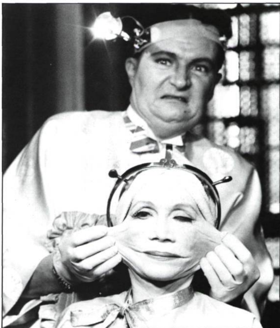
Katherine Helmond et Jim Broadbent dans Brazil

Avec Brazil , nous sommes plongés dans un monde absurde et cruel dans lequel les individus souvent se voient réduits à de simples numéros. Un univers régi par des fonctionnaires bornés faisant tourner une machine bureaucratique implacable. Chacun doit se battre pour ses biens, pour son espace, tandis