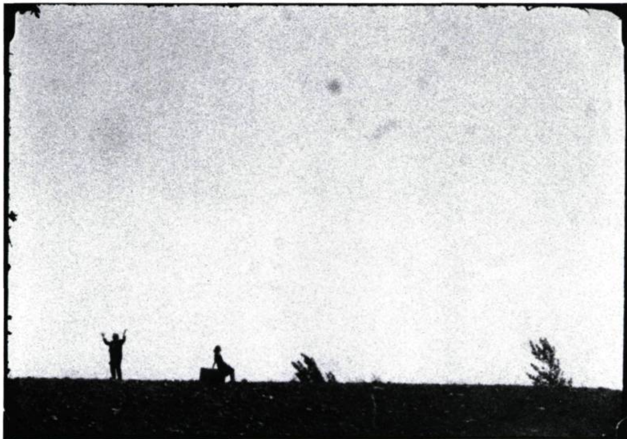
Hilarion et Anne

pagnons de route rencontrent ensuite Nicéphore Niepce qui, dans sa maison pivotante conçue comme une «caméra obscura», travaille justement sur l'héliographie. N'écouant que son courage, dans le pur style de Judex, Anne décide de dérober la statuette en bitume de Judée d'un riche collectionneur qui sera providentiellement réduite en poudre à la suite d'une course-poursuite tout aussi référentielle. Après un essai infructueux et de longs temps de pause, Niepce complétera ses expériences sur le processus de l'écriture même du soleil, donc de la lumière, sur des plaques de verre préalablement enduites de cette poudre et d'huile de lavande et il immortalisera enfin l'image de la thaumaturge. Comme on le constate, c'est à une merveilleuse leçon de principes mêmes de la photographie et du cinéma que nous convie La liberté d'une statue , tout en s'accordant beaucoup de liberté dans la perspective historique des découvertes et du développement des techniques, comme si le réalisateur se jouant des anachronismes, retraçait l'itinéraire de ces inventions pour lui-même, pour son propre plaisir.