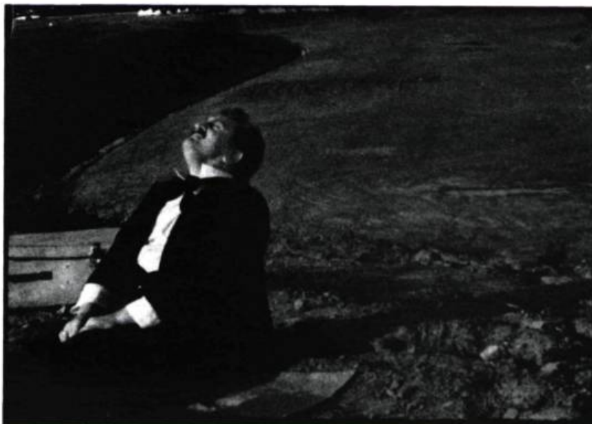
Le réveil d'Hilarion