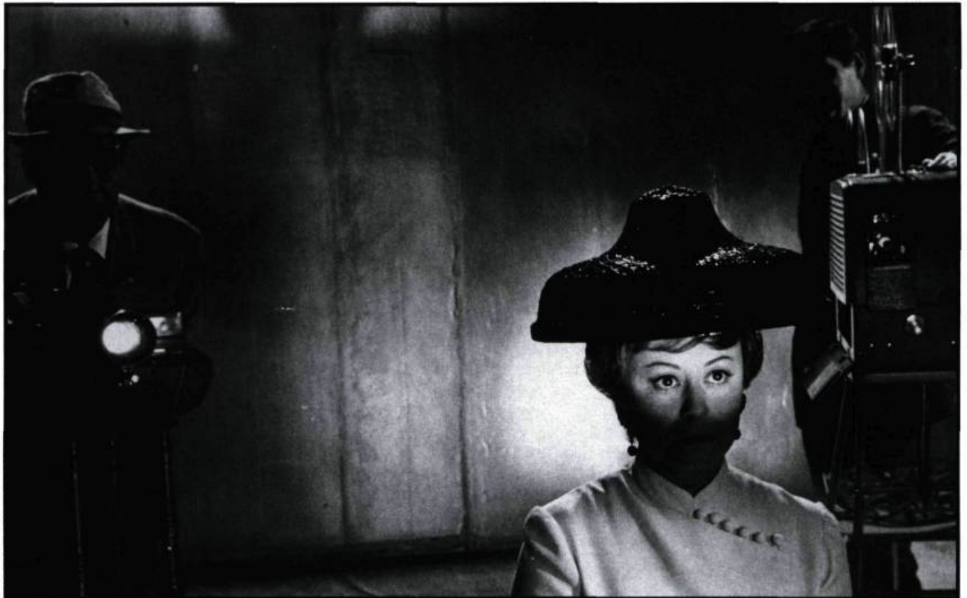
Giulietta Masina dans Juliette des esprits (1965).

tout de suite été un film italien de Federico Fellini avec Giulietta Masina et François Périer, et non pas un film de François Périer. Mais je ne me souviens pas s'il était doublé ou sous-titré. Je ne me souviens pas s'il neigeait à Amos, mais je me souviens des pavés de Rome, des chaussures de Cabiria et de ses jambes. À cet âge-là, dix-sept dix-huit ans, lorsque je sortais d'un film, je me surprénais soudain à marcher comme une des femmes du film. Marcher comme Monica Vitti, par exemple, c'était comprendre tout Antonioni. Je ne pouvais pas marcher comme Giulietta Masina, ni comprendre tout Fellini. C'est qu'on ne marche pas dans les films de Fellini autrement que dans les rêves. Il faut savoir glisser d'un lieu à l'autre. Mieux encore, il faut pouvoir laisser les lieux se glisser dans les jambes, ce qui est un mode onirique de déplacement. C'est ça. Ou encore marcher dans la chaloupe, dans la gondole, dans le cargo, oui, marcher dans un navire qui vogue. Ce n'est pas si confortable. C'est ça que je cherche: l'inconfort dans Fellini. Maintenant, je regarde marcher Juliette des esprits. Marcher peut encore signifier bondir d'une strate de réalité à une autre, et grâce à ces bonds, ouvrir des passages d'une strate à l'autre. Bondir, c'était