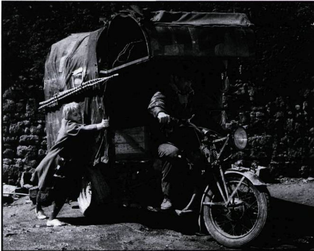
Giulietta Masina et Anthony Quinn dans La Strada (1954).

On est autour de 1958-60. C'est encore vague, encore flou. Je suis à la recherche du moment où Fellini survient ici. Par exemple, Duplessis va mourir. Par exemple, il n'y a pas d'artichauts dans les épiceries, pas de thym frais, pas de magret de canard. Je ne veux pas énumérer tout ce qui n'était pas là. Ça donnerait l'impression d'un manque. Je ne parle pas de manque, mais de différence. Du spaghetti, oui on en a, du macaroni aussi, «trente à quarante variétés comme en Italie», dit la chanson publicitaire des pâtes Lancia. Si La Strada et