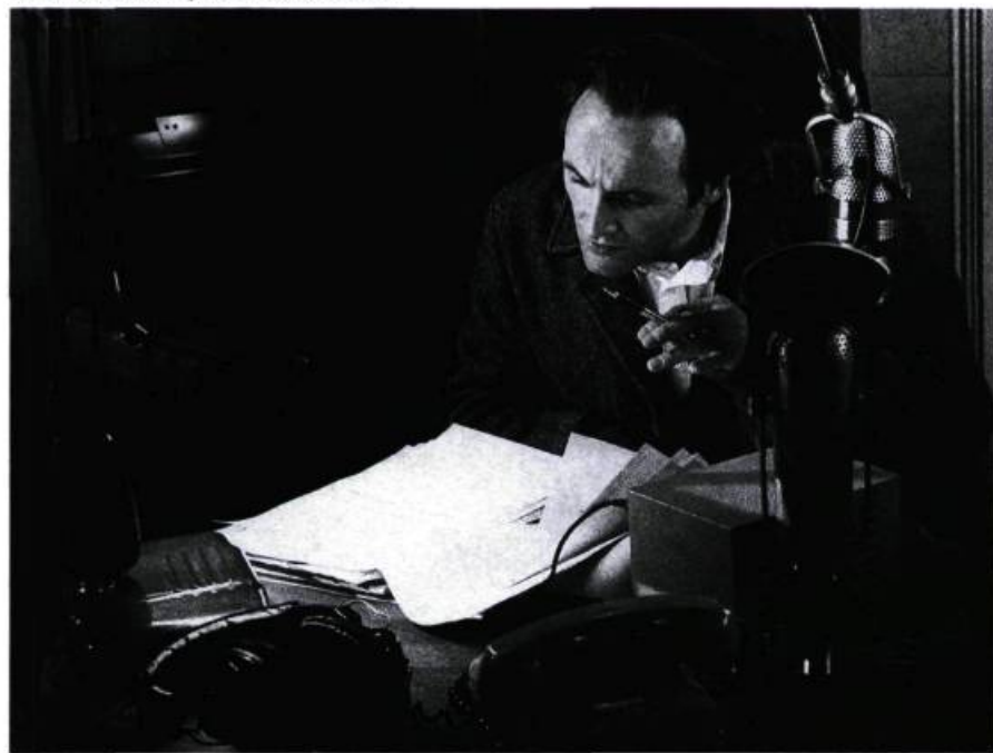
Colm Feore interprète Glenn Gould.

Le film illustre le goût particulier, analytique et maniaque, de Glenn Gould pour la consommation de médicaments et de drogues, en effectuant, dans «Journal d'un jour», un rapprochement avec les prises de vues aux rayons X des organes de son propre corps, accompagnées de calculs mathématiques; alors que, ailleurs, dans «CD-318», de lents travellings en plan serré sur les cordes et l'ensemble du dispositif du piano évoquent la nature des liens