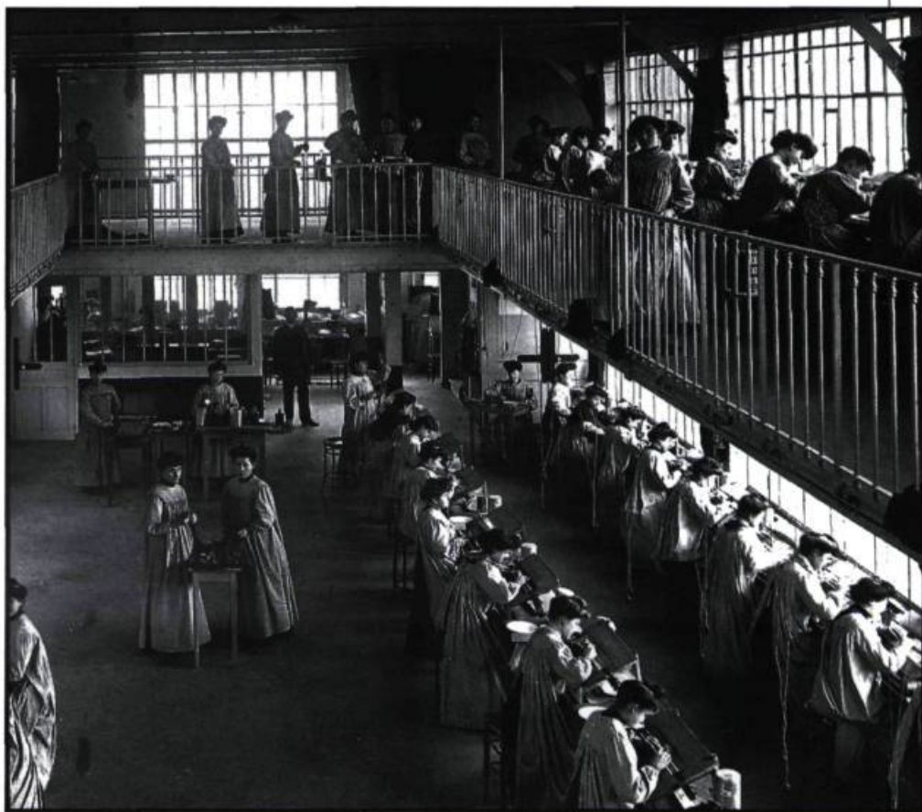
Atelier de coloris de l'usine Pathé de Vincennes.

En mars, les d'Hauterives transportent aussi leur «exposition de tableaux-rayons colorés» (sic) ( La Presse , 15 mars 1901) au Karn Hall (une salle vraisemblablement installée dans l'ouest de la ville, sur Ste-Catherine), puis à la salle Montcalm (rue St-Hubert) tout en continuant d'attirer les foules au Parc Sohmer la fin de semaine. Jusqu'en avril, ils repassent leurs films en couleur et quittent ensuite le Québec au terme d'une tournée qui les a amenés à parcourir la province avec comme attraction principale ces «vues coloriées» qui attirent les foules. Fin 1901, les d'Hauterives présentent un film intitulé La guillotine , obtenu grâce à un «nouveau procédé de vues animées en couleurs naturelles»: «M. d'Hauterive [sic] nous a donné de très jolies vues