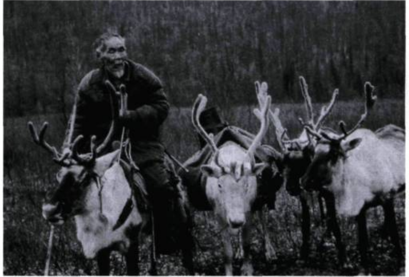
Un météorite obscur chu dans la frénésie cannoise, un film qui lave le regard, Few of Us du jeune cinéaste lituanien Sharunas Bartas 2 .