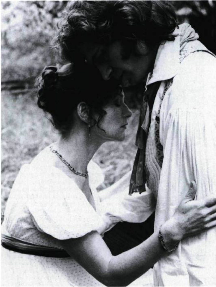
Le lèche et l'académisme des Affinités électives des frères Taviani viennent inscrire le film dans une honnête moyenne sans aspérité ni surprise.

des choses. De la part des cinéastes, la nature de leur travail dépend visiblement plus d'une recherche (ou du maintien) d'un statut social que de nécessités artistiques. Qu'ils renouent avec de vieilles recettes mises au goût du jour (Michael Cimino), qu'ils se contentent de faire preuve d'un savoir-faire qui leur est reconnu (Robert Altman, Spike Lee, Hou Hsiao-hsien), qu'ils sombrent dans le lèche ou l'académisme (Bernardo Bertolucci, les Taviani), ils « assurent », signent des films qui ne démeritent pas tous mais dont très peu sortent d'une honnête moyenne sans aspérité ni surprise. Scénarios réussis, acteurs assez bons, image belle, montage sans bavure, même les sections parallèles ne sortent guère de ce côté « filmiquement correct » qui domine la majeure partie de la production mondiale.