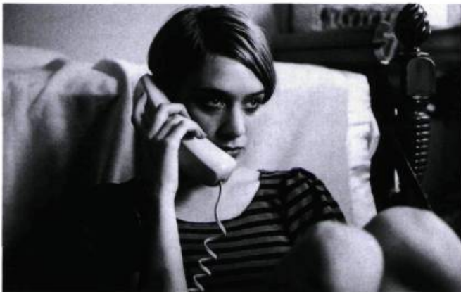
Un de ces films fermement scénarisés, bien joués, déjà vieux comme on en retrouve beaucoup chez les jeunes cinéastes américains: Trees Lounge de Steve Buscemi.