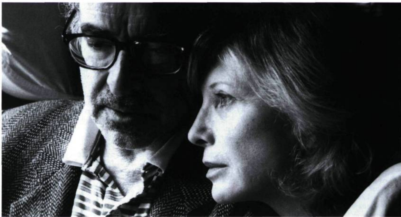
Jean-Luc Godard et Aurore Clément.

la dialectique portant sur l'individu et le nombre). Elle se rend chez Calliclès (Bernadette Lafont, autoritaire, pétillante) afin de discuter de la supériorité de l'être humain et de la justice qu'il peut rendre. Leur dialogue reprend un texte du Gorgias de Platon, dans lequel Socrate aide son élève Calliclès à accoucher de la vérité par sa fameuse méthode, la maïeutique. Leur conversation se déroule dans la maison de Calliclès et celle-ci, tout en répondant aux questions pressantes de Socrate, continue son train-train: repasser le linge, coudre, se maquiller, etc. Cette part réaliste de ce premier chapitre, donnée par les gestes et le lieu, n'occulte pas une mise en scène volontairement théâtrale. À cet aspect théâtral répondront, d'ailleurs, le vrai plateau de théâtre de la seconde partie et les «scènes» de ménage (si on peut dire) de la troisième. Anne-Marie Miéville clôt brusquement la conversation philosophique par un rideau rouge,