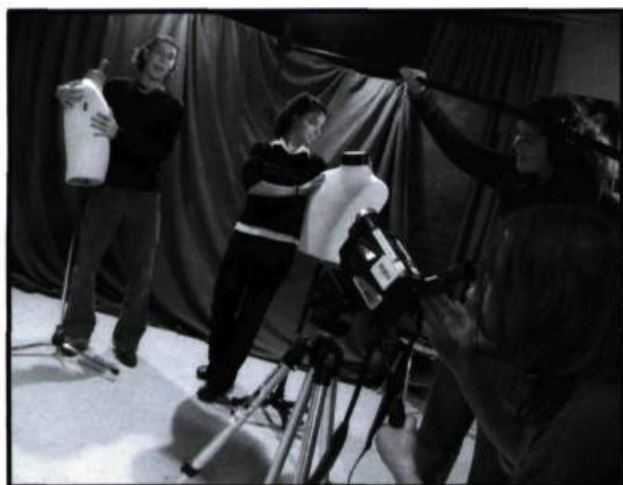
Tournage étudiant au collège François-Xavier-Garneau.

dans l'enseignement, qui ont concocté, bien avant Internet, des réseaux littéraires en bidouillant des Mac+, d'autres qui ont rendu palpables les notions de la physique avec un simple élastique. Ces profs admirables, qui marquent leurs étudiants du sceau de la passion, ne souffrent pas de la tare de tous les réformistes: le prosélytisme. Ceux qui ne comprennent pas le sens de ce mot, d'une éternelle actualité, doivent peut-être leur ignorance à des réformateurs qui ont décrété que l'enseignement du français devait être axé sur les mille mots de vocabulaire nécessaires au décryptage d'une publication de Québecor. Les prosélytes n'aiment pas les nuances, savent ce qui est bon pour nous, veulent notre bien malgré nous; car le discours du réformateur est toujours vertueux, rempli de mots comme équité et consultation. Leur condescendance n'a d'égale que leur dangerosité pour la jeunesse, car au bout du compte, ceux qui écoperont le plus à long terme sont les étudiants, à qui on voudrait faire croire depuis le primaire qu'apprendre est amusant et ne demande pas d'effort.