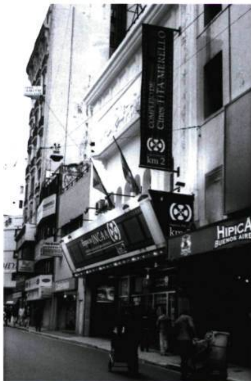
Espacio Tita-Merello/Km/2, le premier cinéma repris par l'INCAA, dans le quartier des cinémas en plein centre de Buenos Aires.

Grand centre de production cinématographique pendant les années 1930-1950, l'Argentine a une culture et une tradition cinématographiques. On y produisait des films sur une base industrielle, bien avant le Québec et le Canada. Toutefois, il faut noter que, contrairement à chez nous, l'INCAA 1 , même s'il revendiquait récemment son autonomie, ne s'est pas transformé en «partenaire» capitaliste de la production : il est plutôt devenu un protecteur officiel de la culture et du patrimoine national qu'est la création cinématographique.