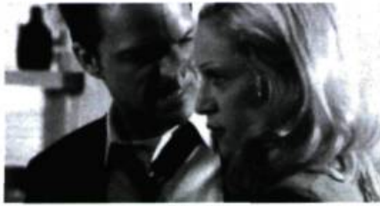
Dangerous Game (1993).