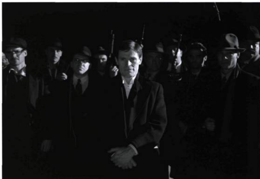
Lars von Trier, un des incontournables cinéastes de la négativité.

Depuis Breaking the Waves , Les idiots , Dancer in the Dark (qui formaient déjà une trilogie) et Dogville , les mélodrames de LVT sur le bien et le mal, la loi et l'injustice ont constamment été soutenus par un personnage féminin, devenu figure sacrificielle comme dans la tragédie grecque (on pense à Eschyle). On peut, dans la mouvance féministe, mais sans renier un pan de la culture occidentale, refuser cette féminisation de la culpabilité. Il est vrai que cette Grace n'est