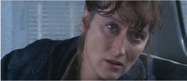
The Bridges of Madison County