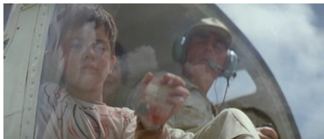
A Perfect World