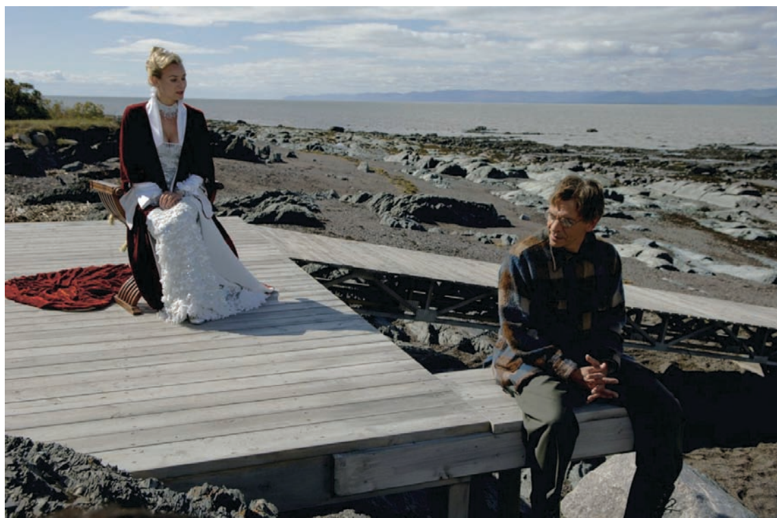
Le choix de Denys Arcand de placer devant son film L'âge des ténèbres le court métrage de Kevin Papatie L'amendement apparaît comme un heureux jumelage.

S'IL FUT RELEVÉ DANS LA PRESSE QUE LE COURT MÉTRAGE L'AMENDEMENT , réalisé par Kevin Papatie, Algonquin de Kitcisakik, fut choisi par Denys Arcand pour accompagner en salle L'âge des ténèbres lors de sa sortie au Québec, il ne se trouva personne pour chercher à expliquer la raison d'un tel choix. On peut supposer que la plupart des critiques ont dû considérer que c'était là simplement un geste de la part d'un cinéaste reconnu et honoré vis-à-vis d'un débutant, et que, face à la magnanimité du prince, la discrétion demeure de mise y compris dans les médias ; dans un tel contexte, en effet, le commentaire peut s'avérer embarrassant autant pour le donateur, qui pourrait sembler avoir délibérément recherché les applaudissements de la galerie, que pour le récipiendaire, potentiellement objet de plus de générosité désintéressée que de reconnaissance véritablement méritée.