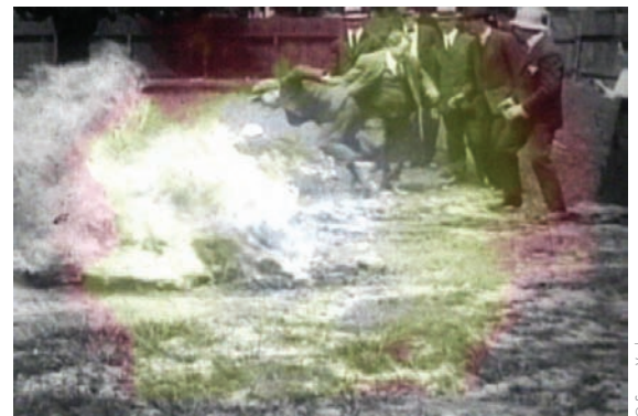
Chant [dans les muscles du chant] (2010) de Suzan Vachon