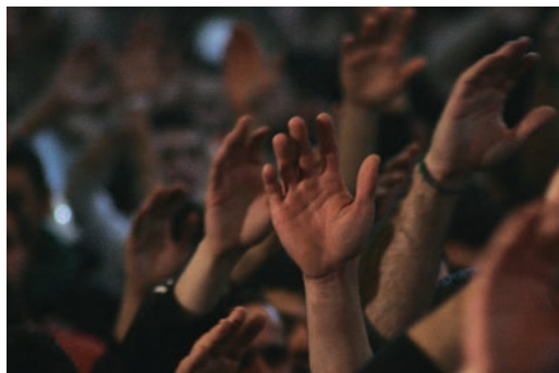
KINGS OF THE WIND & ELECTRIC QUEENS et MASSE MYSTIQUE

sur le discours, mais dans le sens fort du terme : non pas le spectacle critiqué par Debord, ni le spectaculaire que l'on nous donne habituellement à voir dans les images, médiatiques surtout, qui banalisent le réel par leur répétition. Il s'agit ici d'une réhabilitation du cinéma comme spectacle non pas distractif mais impressionnant, laissant dans son sillage une trace durable. C'est ce qui donne à ces deux films leur puissance évocatrice, ce qui fait d'eux de pures expériences de cinéma. Pourquoi rappeler l'omniprésence de la mort dans la société indienne quand la vision nocturne d'un cheval digne de Goya l'évoque si bien ? Pourquoi énoncer les dangers de l'extrémisme religieux quand le spectateur, harassé par la longue litanie collective, est déjà abasourdi par cette expérience ? Non narratifs et résolument dénués de « discours », les deux films font preuve d'une maîtrise absolue dans la