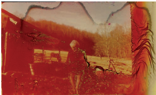
Quiet Zone et Passage (2008)