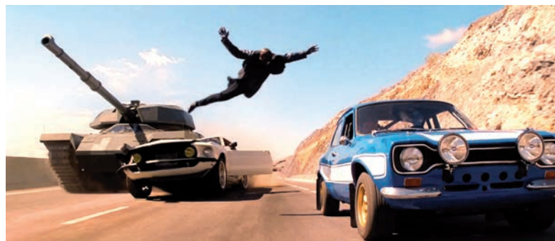
Domino (2005) Tony Scott / Fast & Furious 6 (2013) Justin Lin

se sont d'ailleurs empressés d'émettre des doutes quant à la valeur intrinsèque des combats menés par les tenants de cette école de pensée : « Les tenants du V.A. rendent un grand service en reconnaissant que Hyams et Paul W.S. Anderson abordent leur sujet avec une inventivité plus variée que, par exemple, Michael Haneke et Olivier Assayas – et lorsqu'ils supposent qu'ils auraient fait de Skyfall un meilleur film que celui de Sam Mendes. Mais en termes de valeur absolue du cinéma et de l'art, ce sont là des standards plutôt bas. » 4