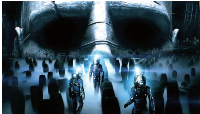
Prometheus (2012) Ridley Scott