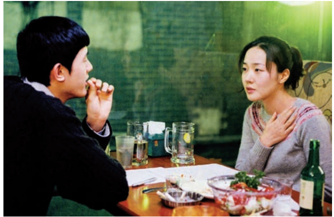
Tale of Cinema (2005)

La figure du réalisateur prolifique ne date pas d'hier. Certains, comme Rainer Werner Fassbinder, Jess Franco ou Steven Soderbergh, ont mis à profit leur productivité compulsive afin de bâtir une œuvre aussi imposante qu'hétéroclite. D'autres, comme Éric Rohmer, John Ford ou Yasujiro Ozu ont, au contraire, réussi à développer des univers cohérents, marqués par la répétition de motifs et de préoccupations thématiques.