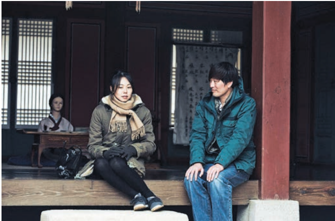
Right Now, Wrong Then (2015) Hong Sang-soo