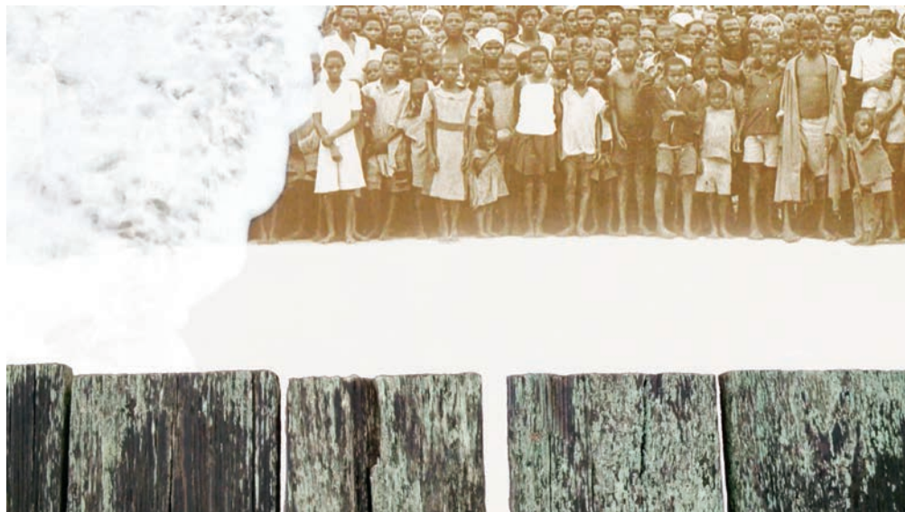
Blancs de mémoire (2013), vidéo, Galerie Antoine Ertaskiran

D 'aussi loin que je me souviens, le cinéma a toujours fait partie de ma vie. Le premier film que j'ai vu en salle, The Sound of Music , m'avait complètement ébloui. C'était en 1965, au cinéma Crémazie, j'avais 8 ans.