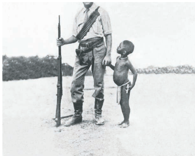
Élément de Inner Sanctum (1995), Collection MNBAQ

Dans les années 1970 et 1980, il y avait encore plusieurs salles de cinéma à Montréal qui présentaient des films d'auteur des quatre coins du monde. J'ai eu plusieurs coups de cœur au cinéma Élysée : Ettore Scola, Tati, Kieslowski. J'ai vu mon premier Woody Allen au Cinéma 5 et Tarkovski au Cinéma Parallèle. J'ai eu la chance de voir It's A Wonderful Life de Capra à la Cinémathèque française à Paris, Harvey de Henry Koster au cinéma Regency à New York, Sherlock Jr de Buster Keaton au Silent Movie Theater à Los Angeles qui, par miracle, existe toujours. Visionner ces films dans de tels lieux, en copie très souvent impeccable, rendait l'expérience encore plus magique, comme un moment figé dans le temps.