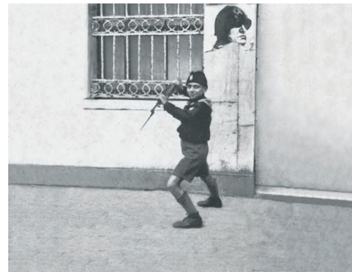
Éléments de Inner Sanctum (1995), Collection MNBAQ

En 1995, je décide de m'inscrire à un stage au New York Film Academy. Je voulais comprendre comment se construit un film. On nous faisait tour à tour travailler à différentes tâches de production (éclairage, prise de son, mise en scène, mixage, etc.). On tournait en 16mm et c'est sur une table de montage Steinbeck que j'ai compris ce qui m'intéressait plus particulièrement dans la production d'un film : comment, en utilisant le même piéage, on peut créer différents scénarios. Tout était une question de coupe, de colle et de point de vue... Je me retrouvais en terrain connu.