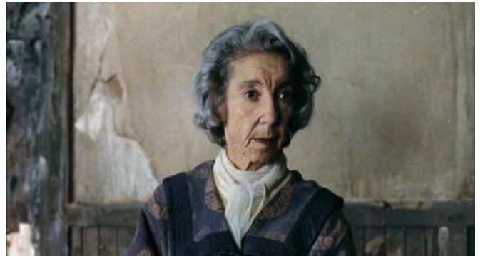
[1] Blue Velvet (Dorothy Vallens), [2-3] Twin Peaks (Sarah Palmer – Mrs Tremond)

qui s'interroge sur la nature des rêves et prend lui-même la forme d'une vision onirique. Dans le poème, le rêveur se trouve à l'intérieur d'un temple dédié à Vénus, la déesse de l'amour. Il y voit une tablette où est inscrite l'épopée de L'Énéide , et il se souvient comment Jupiter a ordonné à Énée de trahir son amante Didon, ce qui causa le suicide de cette dernière.