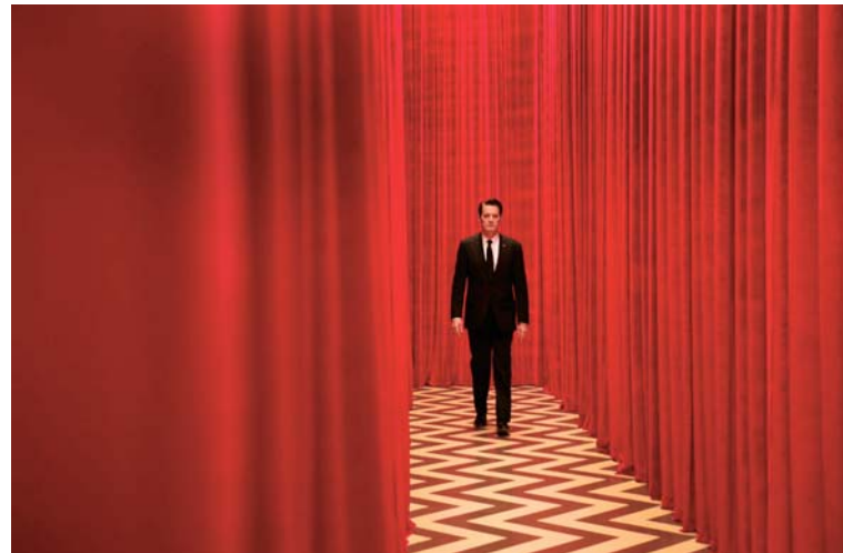
Twin Peaks: Fire Walk with Me (Harry Dean Stanton) et Twin Peaks: The Return

« I l y a des choses dans cet univers qui sont plus grandes que nous tous, et une tortue est l'une d'entre elles », affirme Howard, incarné par David Lynch dans Lucky de John Carroll Lynch (aucun lien de parenté). Le film qui, en août dernier, a fait le bonheur des festivaliers de Melbourne et de Locarno, est une ode au vieillissant Harry Dean Stanton, l'un des fidèles acteurs/amis du cinéaste que l'on a pu voir dans Twin Peaks: Fire Walk with Me , Inland Empire , Wild at Heart et The Straight Story . À 91 ans, et face à une mort imminente, Stanton cherche dans Lucky le sens de l'existence, ainsi que le courage de plonger dans « le Vide », comme il l'appelle, cet « après » qui semble tout particulièrement obséder Lynch dans Twin Peaks: The Return .