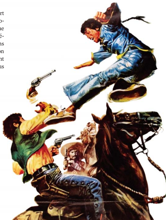
Shogun Joe (Mario Caiano, 1973)

Le titre du film indique déjà une piste de lecture fertile. Ce groupe d'ouvriers allemands qui prend ses quartiers en territoire bulgare avec une mentalité de conquérant pourrait être l'illustration de la colonisation en Amérique et ses dérapages issus de l'ignorance de l'autre et de sa culture. Même si l'un d'eux, plus subtil, tente de sauver la mise en établissant le « contact » de façon plus civilisée. – GM