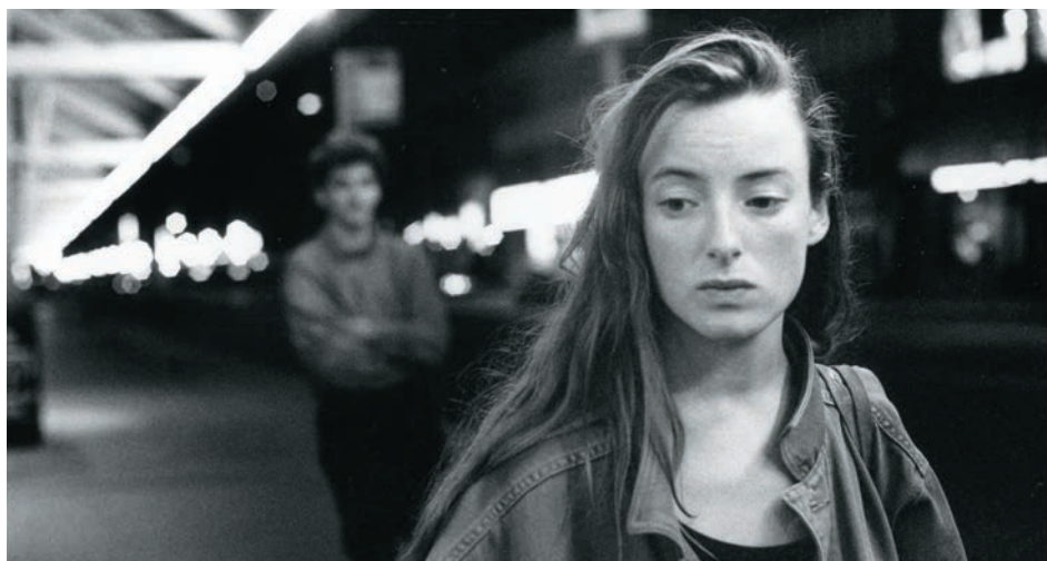
↑ Deux actrices (1993) → Sonatine de Micheline Lanctôt (1984)