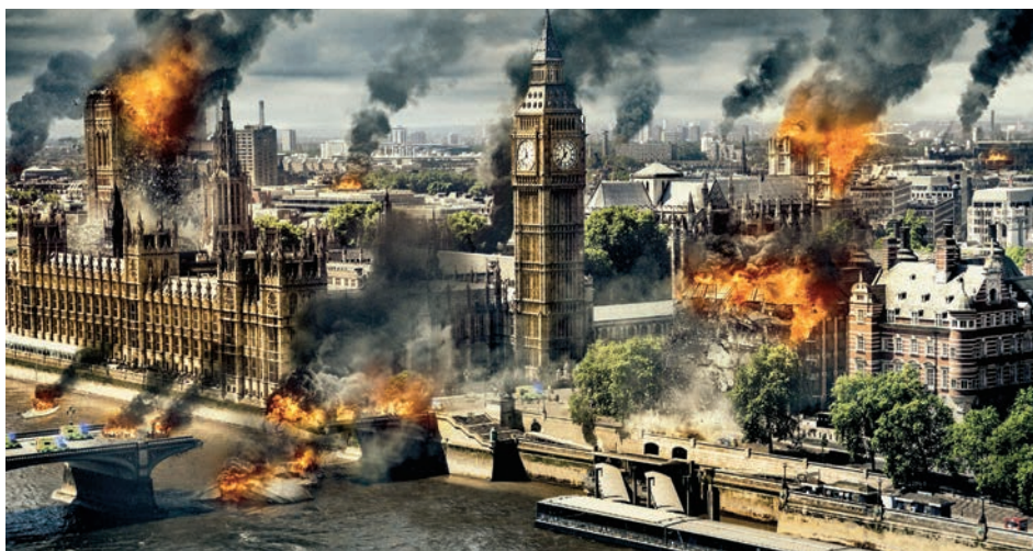
↑ London Has Fallen de Babak Najafi (2016)