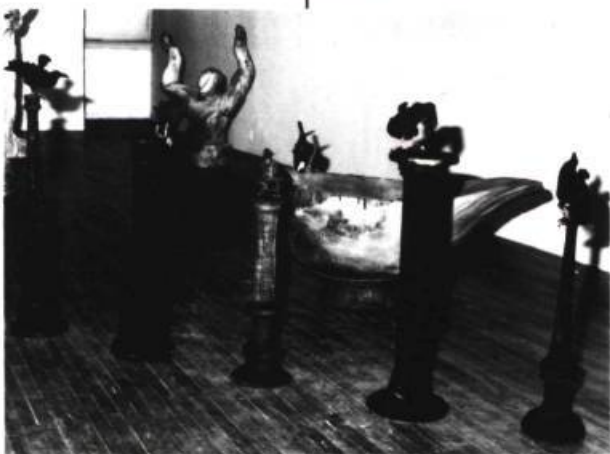
Vue partielle de l'exposition Histoires de bois : au premier plan, Les noces de corneilles de Louise VIGER, 1988 (bois et matériaux divers) ; à l'arrière-plan, Réponse à une proposition de Milan Kundera de David MOORE, 1988 (bois et plomb).