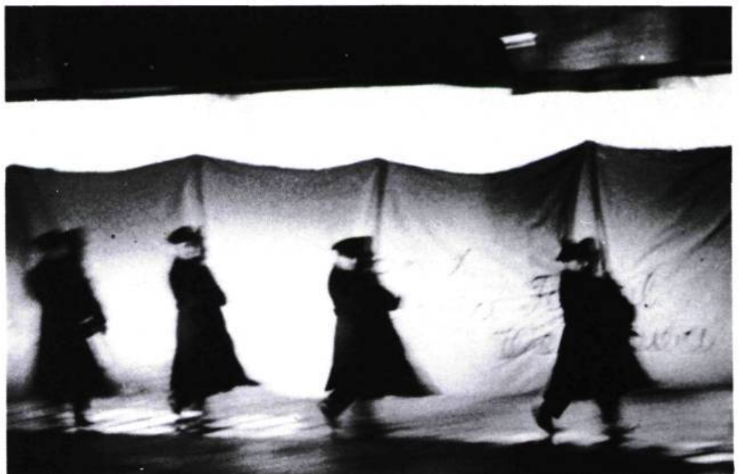
Tadeusz KANTOR, Happening La Lettre, Varsovie, 1967.