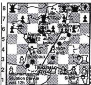
("Situation prévue vers 12 h.")