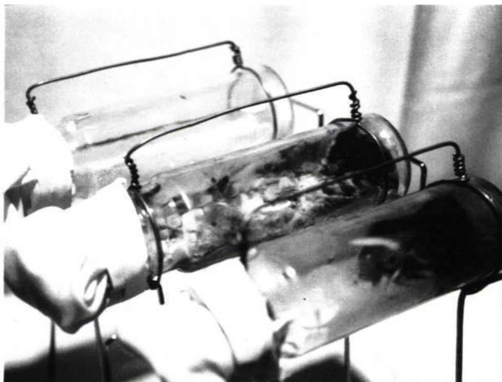
Les Grands Perturbateurs III, Guy BLACKBURN.