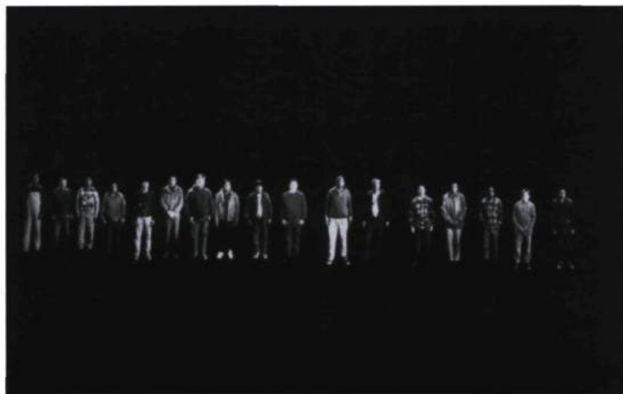
[événement] Quatrième Biennale de Lyon, Halle Garnier, 9 juillet au 24 septembre 1997 [photos] (gauche) Jason RHOADES, Uno momento/The theater in my dick/A look to the physical/Ephemeral, 1996 (droite) Gary HILL, Viewer, 1996.