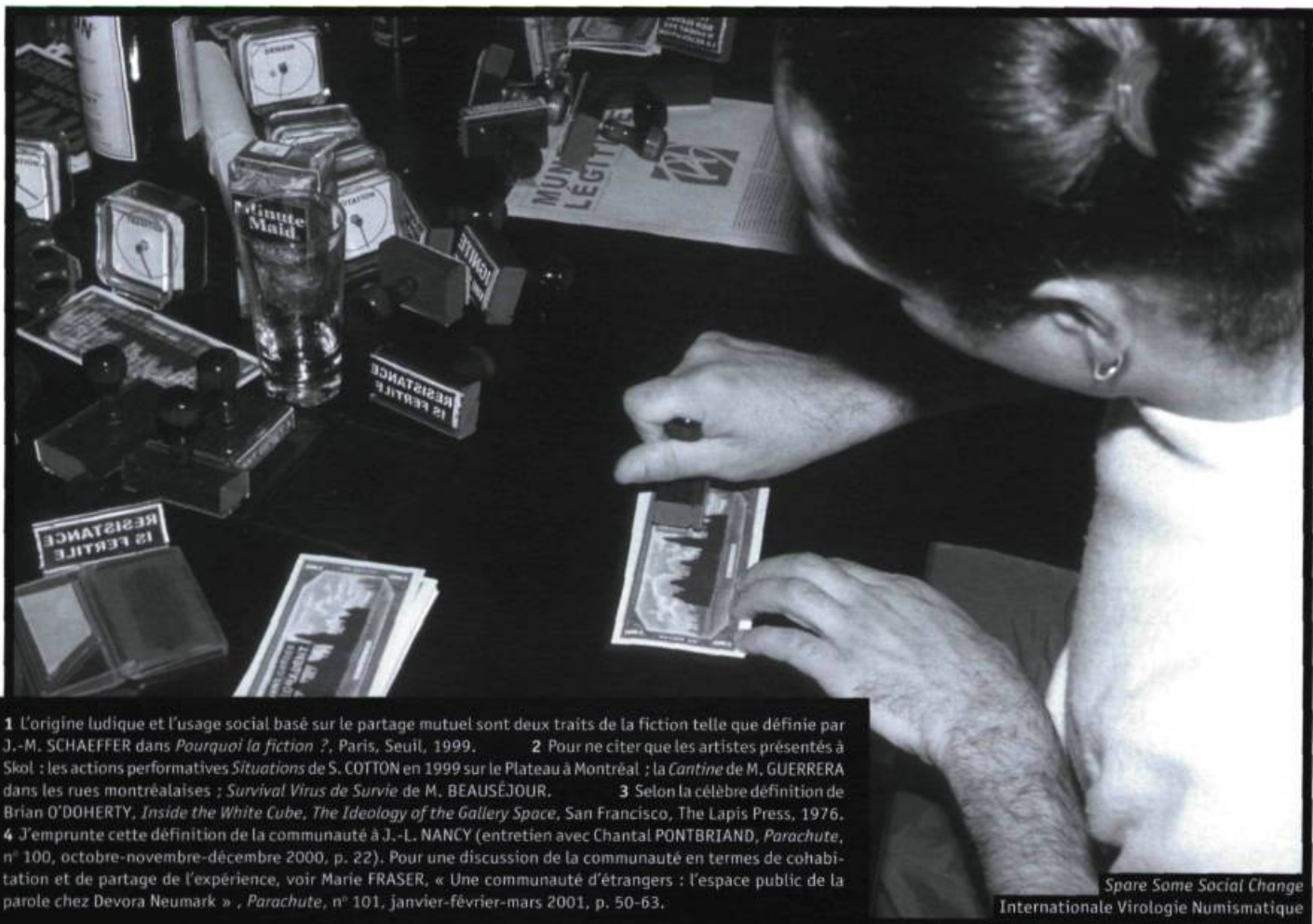
Spare Some Social Change Internationale Virologie Numismatique